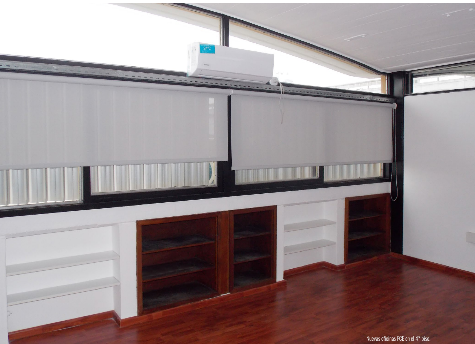
Nuevas oficinas FCE en el 4° piso.

MV: En línea con la pregunta anterior, también podemos destacar la puesta en valor de las luminarias de la biblioteca mediante la instalación y cableado de 212 nuevos artefactos de iluminación, lo que nos permite tener el 100% del espacio con tecnología led y la instalación, a finales del año 2018, de un sistema de luces inteligentes en las aulas B y C del área posgrado; las cuales se encienden cuando se detecta presencia en el aula y se ajusta de acuerdo a la intensidad de luz natural que entra por las ventanas. Este nuevo sistema genera un ahorro de 88% por el cambio de tecnología a luz led y por las automatizaciones mencionadas; además pudimos recuperar la inversión en un plazo de dos años.