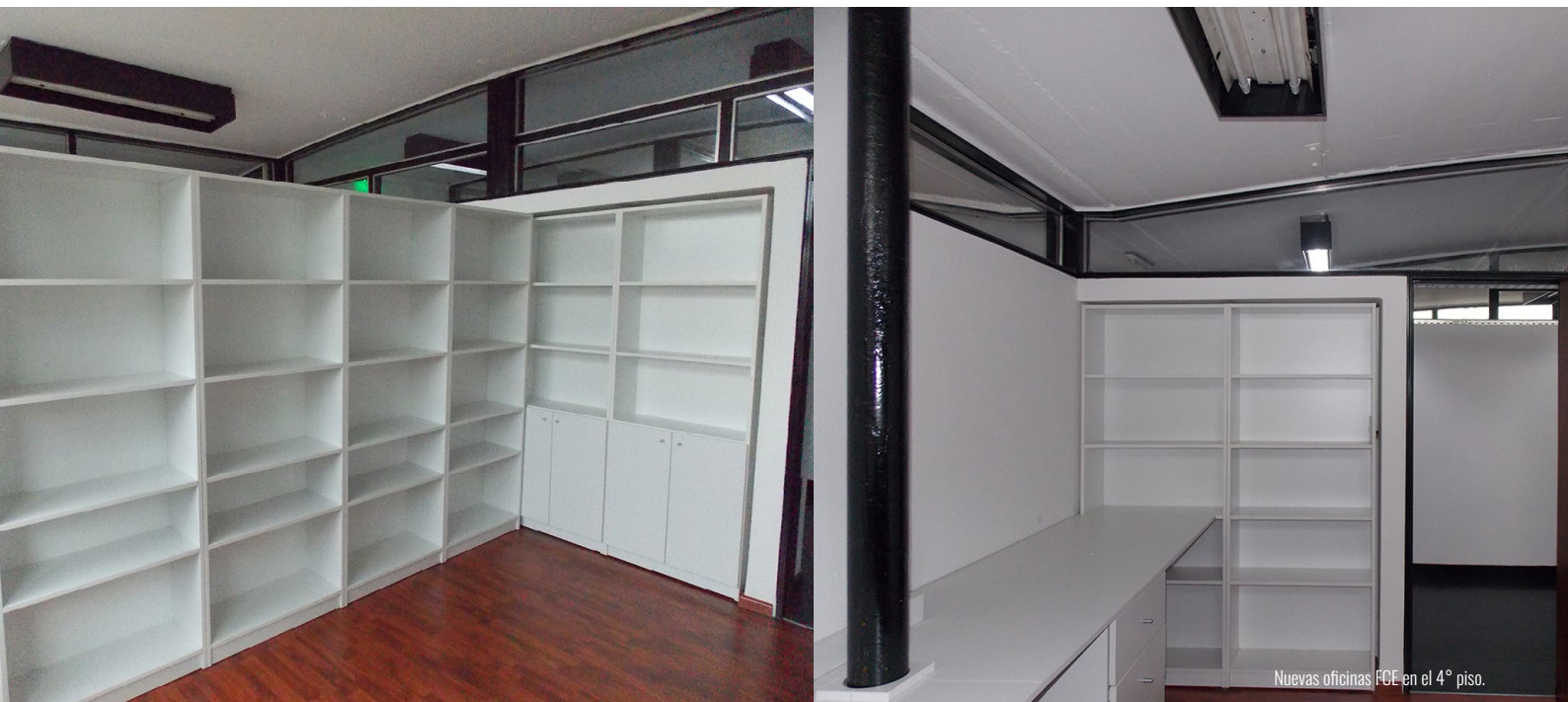
Nuevas oficinas FCE en el 4° piso.

unos 200 m 2 de oficinas y salas de reuniones, y unos 100 m 2 de áreas comunes. Todos los espacios fueron equipados con mobiliarios fijos, bibliotecas, estantes de guardado, equipamiento de oficina, cortinas tipo roller sun screen y equipos de aire acondicionado. Por último, se han colocado en todas las oficinas y espacios comunes pisos flotantes similar madera y pisos de goma de alto tránsito respectivamente, un nuevo sistema eléctrico y luminarias led, como así también se han puesto en valor los parasoles verticales de aluminio exteriores característicos del edificio.