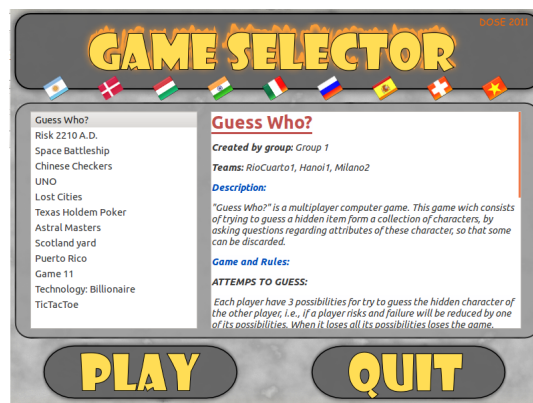
Figura 1: GUI principal del proyecto.

El éxito del proyecto no sólo dependió del éxito de un equipo (local), sino que también dependió de los equipos socios distribuidos en diferentes países.