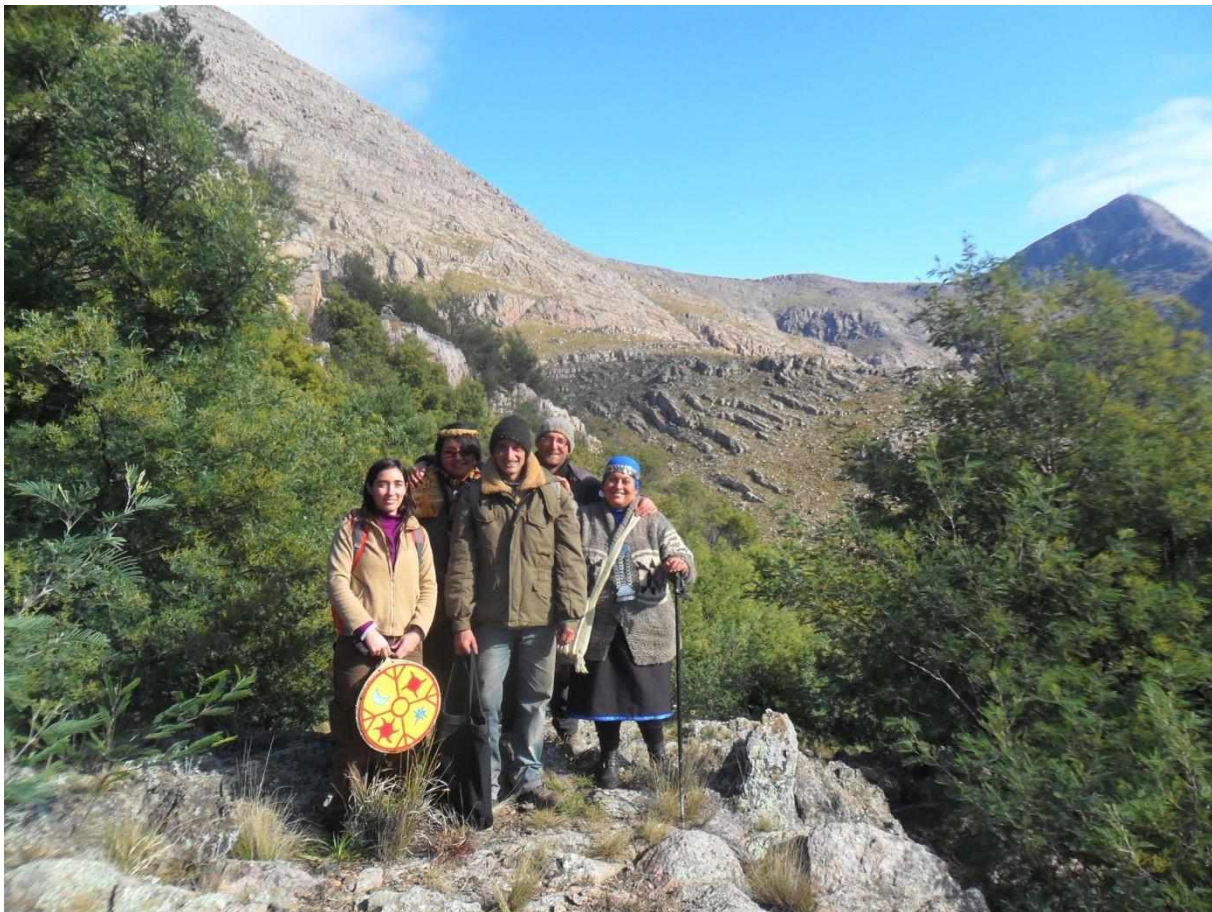
Figura 4. Visita a Gruta de los Espíritus en el año 2015, junto con integrantes de las comunidades originarias.

Ciertos estudios derivados de la semiótica peirceana y/o de la arqueología del paisaje han aportado herramientas para pensar los paisajes sociales y los espacios simbólicamente contruidos, como se puede observar en el caso de las investigaciones sobre arte rupestre del Sistema Serrano de Ventania. Al mismo tiempo, el giro ontológico habilitó el acceso a otras fuentes de información ( ie. etnohistórica, etnográfica; Oliva, Panizza y Morales, 2018), y el encuentro entre actores sociales que reivindican sentidos diversos sobre los paisajes o entornos (Figura 4), a partir de un modelo relacional centrado en la perspectiva de habitar el paisaje, una experiencia compartida de actividades y prácticas sociales.