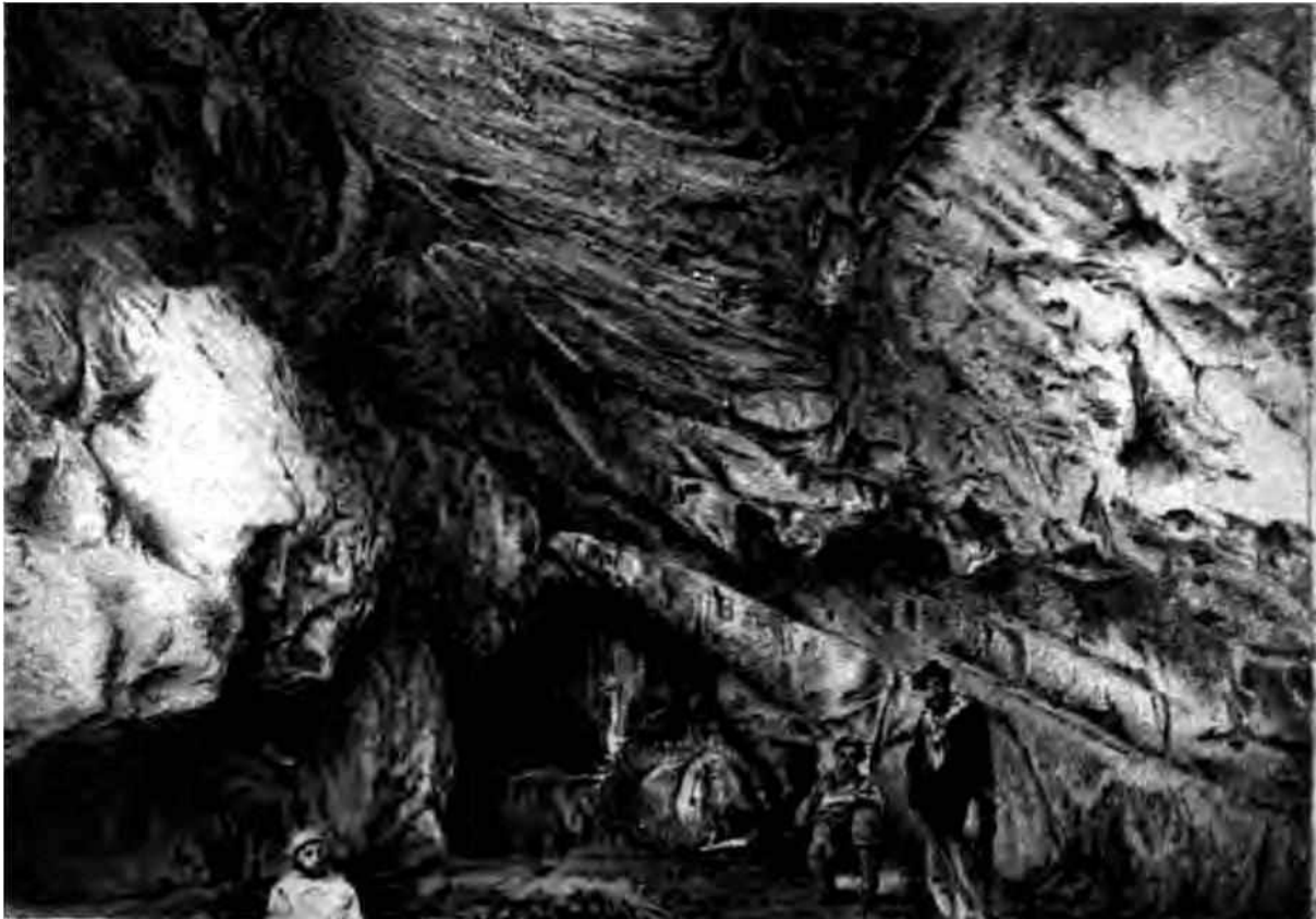
Figura 2. Fotografía correspondiente a la lámina V del estudio publicado por Holmberg (1884), consiste en la vista del vestíbulo de la Gruta de los Espíritus desde la entrada.

En los años '60 se reiniciaron los estudios en el área de Ventania, a partir de los trabajos de Austral y Madrazo, quienes desde concepciones teóricas diferentes, emprendieron el estudio de varias localizaciones con evidencias de ocupación indígena, tanto en sitios superficiales como en estratigrafía (Madrazo, 1967, 1968; Austral, 1966, 1972).