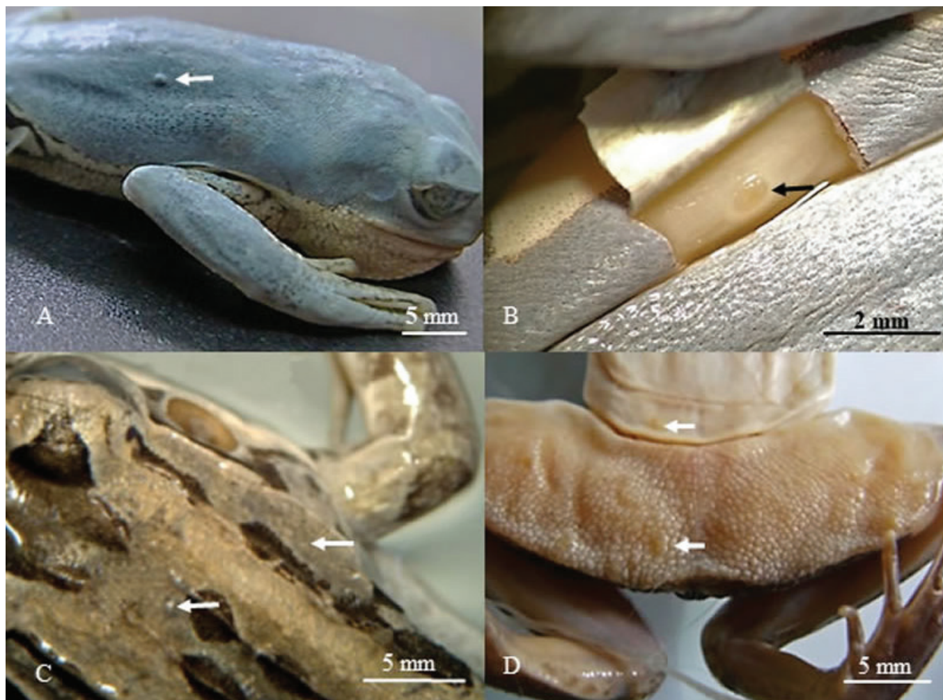
Figura 1. Aspecto general de las protusiones provocadas por Hannemania sp. en el tegumento de Pithecopus aureus y Leptodactylus chaquensis . Pithecopus aureus : A. Protusión de igual coloración (flecha), B. Vista externa de cápsula subtegumentaria en dorso de muslo izquierdo (flecha). Leptodactylus chaquensis : C. Protusiones ligeramente más claras (flechas), D. Protusiones en la región ventral del vientre y muslos.

anteriores y posteriores (Fig. 1D), cara interna de los muslos, región pélvica y zona dorsal de la cabeza. En L. bufonius , la ubicación de los parásitos fue 12 en la región ventral del cuerpo y 16 en posición dorsal. Estas formaciones contienen una larva subtegumentaria del ácaro Hannemania sp. (Fig. 1 B).