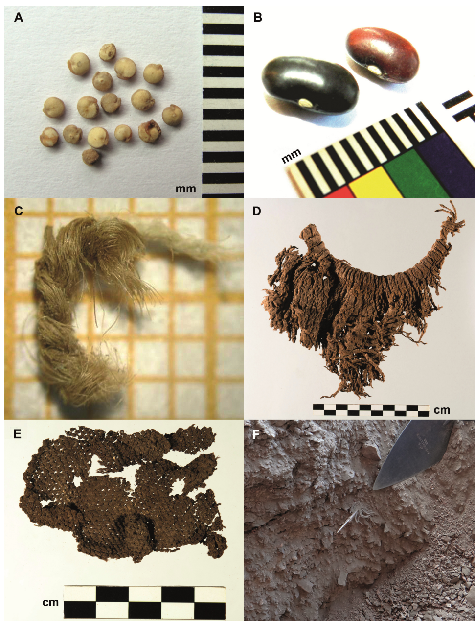
Figura 2. Preservación excepcional de restos orgánicos en los rellenos analizados: A. Macrorrestos vegetales, semillas de Chenopodium quinoa var. quinoa (quínoa), Alero 1 de Punta de la Peña 9 (modificada de Aschero et al. , 2020: 70), B. Macrorrestos vegetales, Semillas de Phaseolus vulgaris var. vulgaris (poroto común cultivado), Alero 1 de Punta de la Peña 9, C. Fragmento de cordel en fibra vegetal, Alero 1 de Punta de la Peña 9 (escala en mm) (cortesía M.A. Aguirre), D. Fragmento de vestimenta, Alero Peñas Chicas 1.7 (modificada de Aschero et al. , 2020: 87), E. Fragmento de vestimenta, Alero Peñas Chicas 1.7 (cortesía M. Alonso) y F. Pluma (ave indet.), Alero 2 Punta Pórfido.

En lo referido a la preservación excepcional por condiciones microambientales, podemos destacar el caso de tres aleros localizados en la Puna de Catamarca, bajo un clima fresco y muy seco (Tabla 1), que presentan la mayor variedad de restos orgánicos preservados, incluyendo vegetales, plumas, pelos y textiles (Fig. 2A, B, C, D, E y Tabla 2). Se trata del Alero 1 de Punta de la Peña 9 (Trucchi et al. , 2021; Winkel et al. , 2018), el Alero Peñas Chicas 1.1 y el Alero Peñas Chicas 1.7 (Hocsman & Babot, 2018).