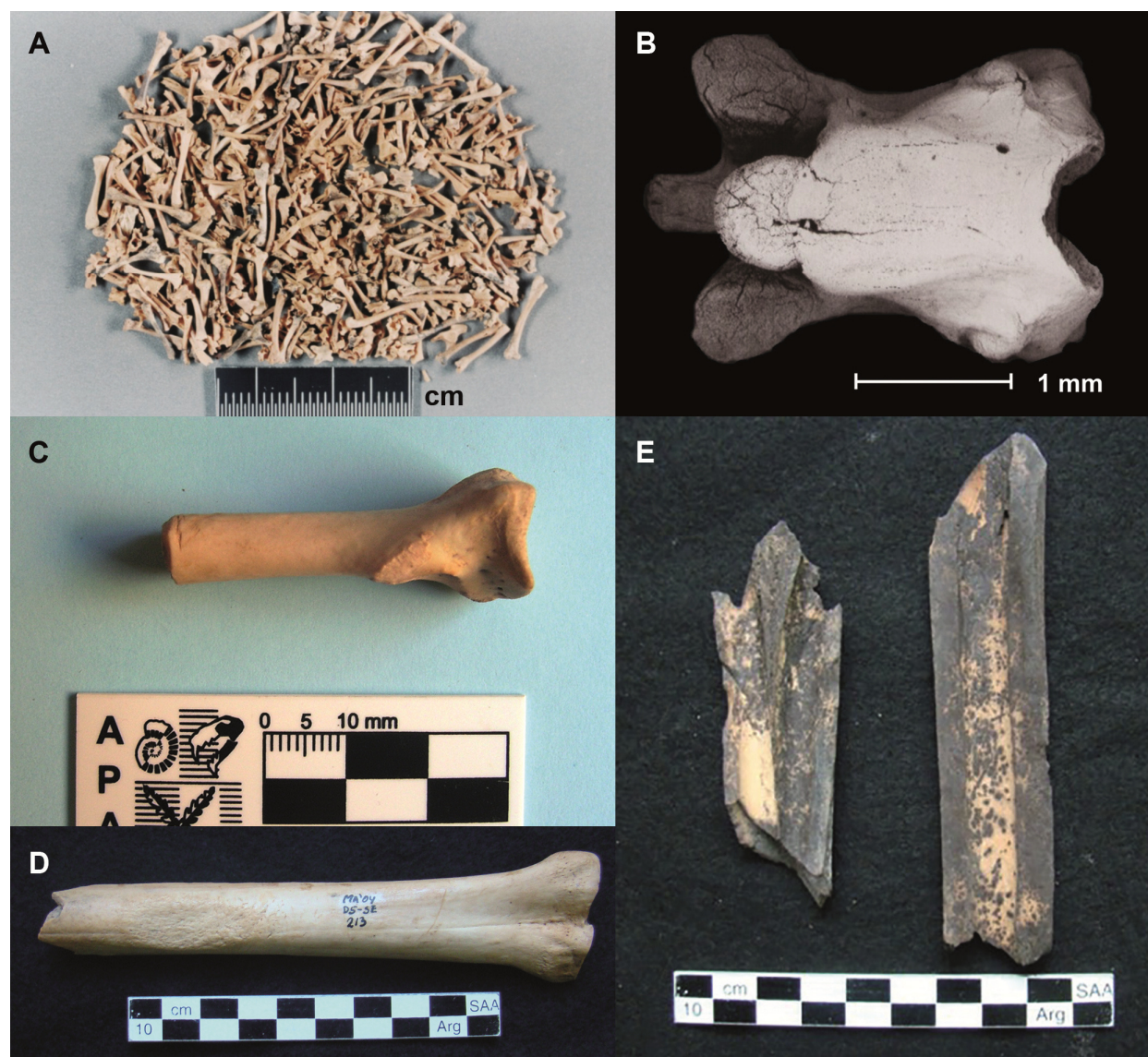
Figura 3. Preservación de restos óseos: A. Restos óseos de lagartija, Alero 12 (adaptada de Kligmann, 2009), B. Vértebra presacral de lagartija, Alero 12 (25 aumentos) (adaptada de Kligmann, 2009), C. Epífisis de radio de Vulturgrifus (cóndor), Cueva Quebrada del Real (adaptada de Rivero et al. , 2010), D. Restos de camélidos, Cueva Maripe, Cámara Norte (adaptada de Miotti & Marchionni, 2013) y E. Restos de camélidos con manchas de óxido de manganeso, Cueva Maripe, Cámara Sur (adaptada de Marchionni, 2013).

Como caso particular, en el Alero 12 (Catamarca), se preservaron abundantes materiales tafonómicos (restos óseos y dentarios de lagartijas) que nunca estuvieron expuestos, dado que se supone que las lagartijas murieron mientras hibernaban en madrigueras de roedor (Albino & Kligmann, 2007; Kligmann, 2009; Kligmann et al. , 1999). Ese hecho seguramente también contribuyó a su excelente preservación (Fig. 3A, B).