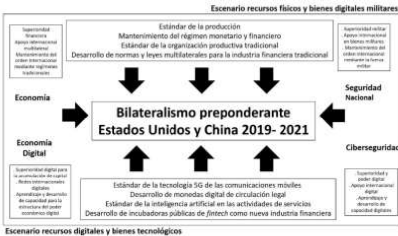
FIGURA 1. COMPONENTES Y DIRECCION DEL BILATERALISMO PREPONDERANTE ESTADOS UNIDOS Y CHINA, 2019- 2021.