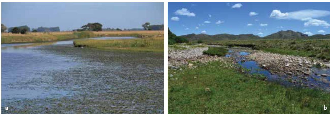
Figura 2: Arroyos de la Ecorregión Pampa. a) A° Juan Blanco (Pdo. de Magdalena, Prov. Buenos Aires) caracterizados por meandros y semicubierto por macrófitas. b) A° Ventana en las serranías de Sierra de la Ventana, con sedimentos pedregosos.

Estos abarcan desde los niveles supra-organismicos, tales como índices bióticos, biomasa algal y cambios estructurales de las comunidades, hasta los que implican el nivel de organismo y subcelular, como cambios morfológicos de