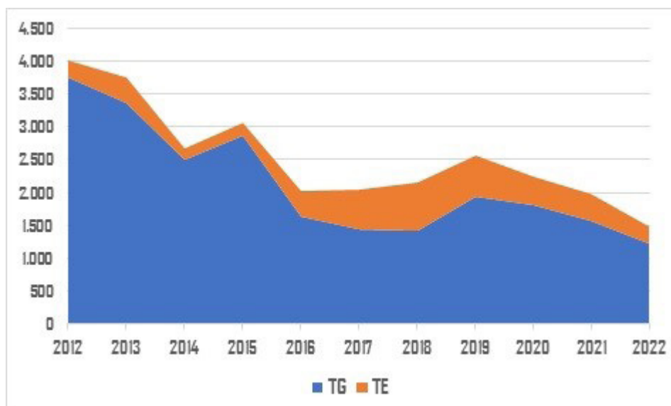
Gráfico 1: Relación entre becas de CONICET en TG y en TE 2012-2022. Fuente: Elaboración propia en base a Informes de Gestión de CONICET disponibles en https://www.conicet.gov.ar/transparencia-activa/

Como se observa, en todo el periodo tiene preeminencia la modalidad libre o de TG, con una cantidad de becas otorgadas mucho mayor.