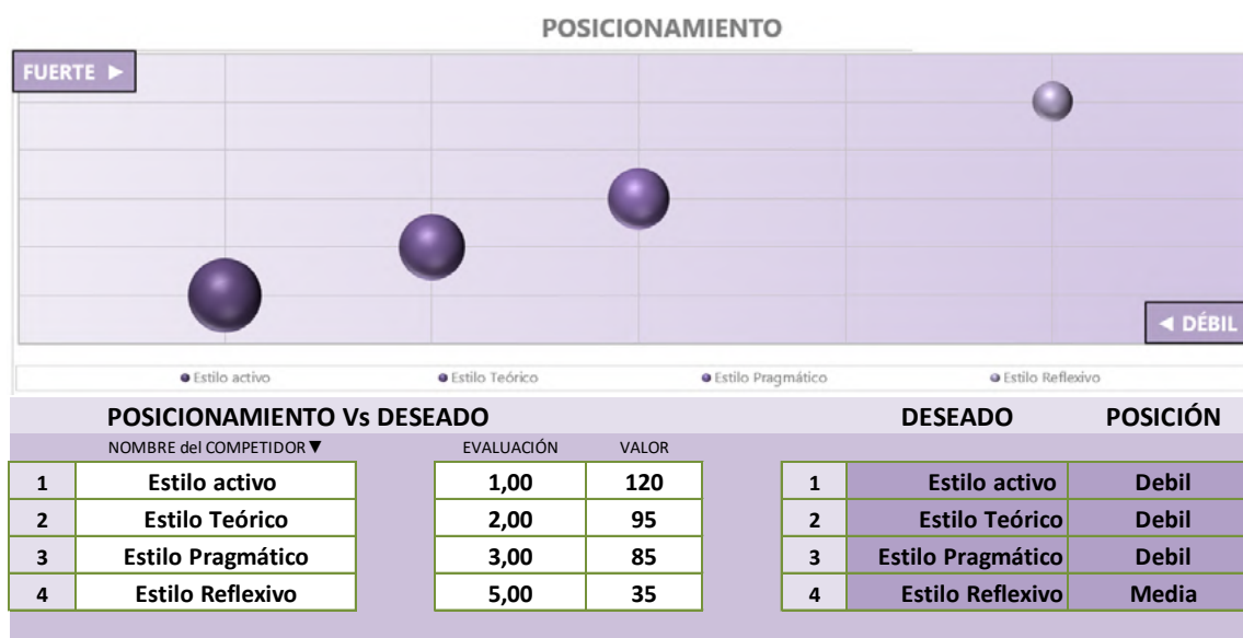
Figura 2 Matriz Estilo de Comportamiento

Como se observa, el destino San Vicente posee solo dos ventajas frente a su principal competidor y ocho desventajas, dos de las cuales son consideradas ligeras frente a su competidor –imagen tecnológica y segmentos de mercados definidos–. Respecto a las ventajas, tiene una ligera ventaja en el parámetro calidad de los productos, lo que demuestra que se tienen que definir acciones correctivas tanto de índole publicitaria como de sostenibilidad para lograr estilo de comportamiento del consumidor turístico más pragmático y reflexivo para que genere y transmita emociones positivas del destino. En la Figura 2 se observa una correlación de estos parámetros que muestran el comportamiento de las fuerzas actuantes.