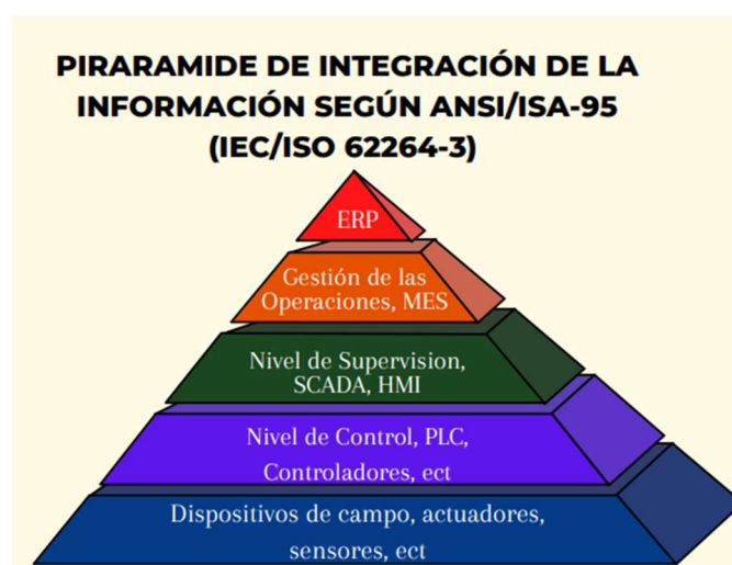
Fig. 1. Modelo de integración vertical de la Información que propone el estándar ANSI/ISA 95.

El estándar ISA 95 define un modelo de jerarquía funcional para categorizar las funciones de las empresas industriales. Este modelo de 5 capas es conocido como la pirámide de automatización.