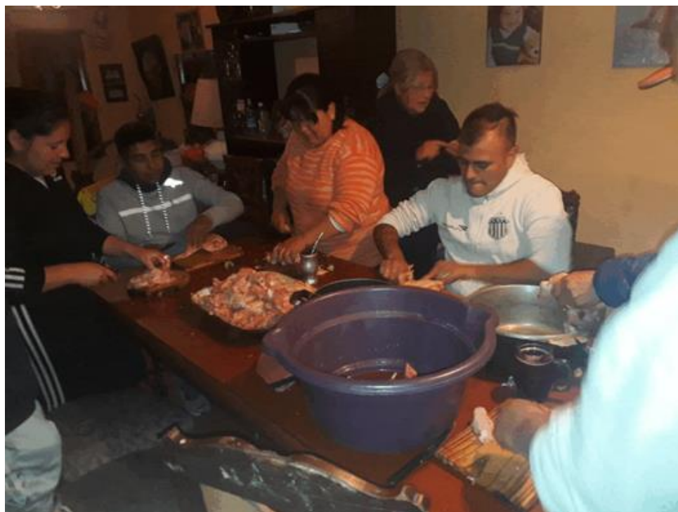
Toma directa. Fotografía digital. Córdoba 2020.