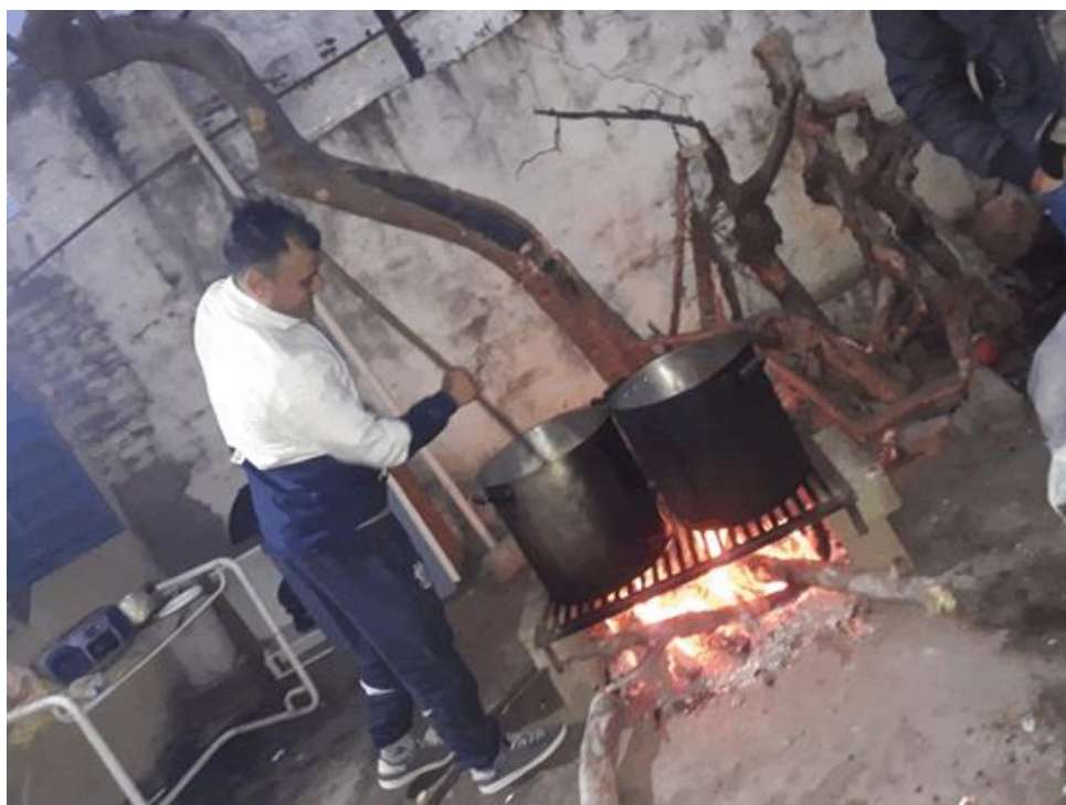
Toma directa. Fotografía digital. Córdoba 2020.