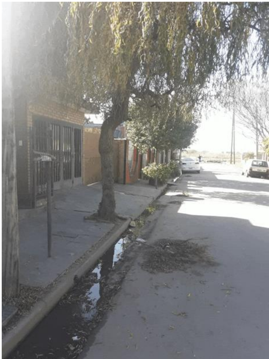
Toma directa. Fotografía digital. Córdoba 2020.