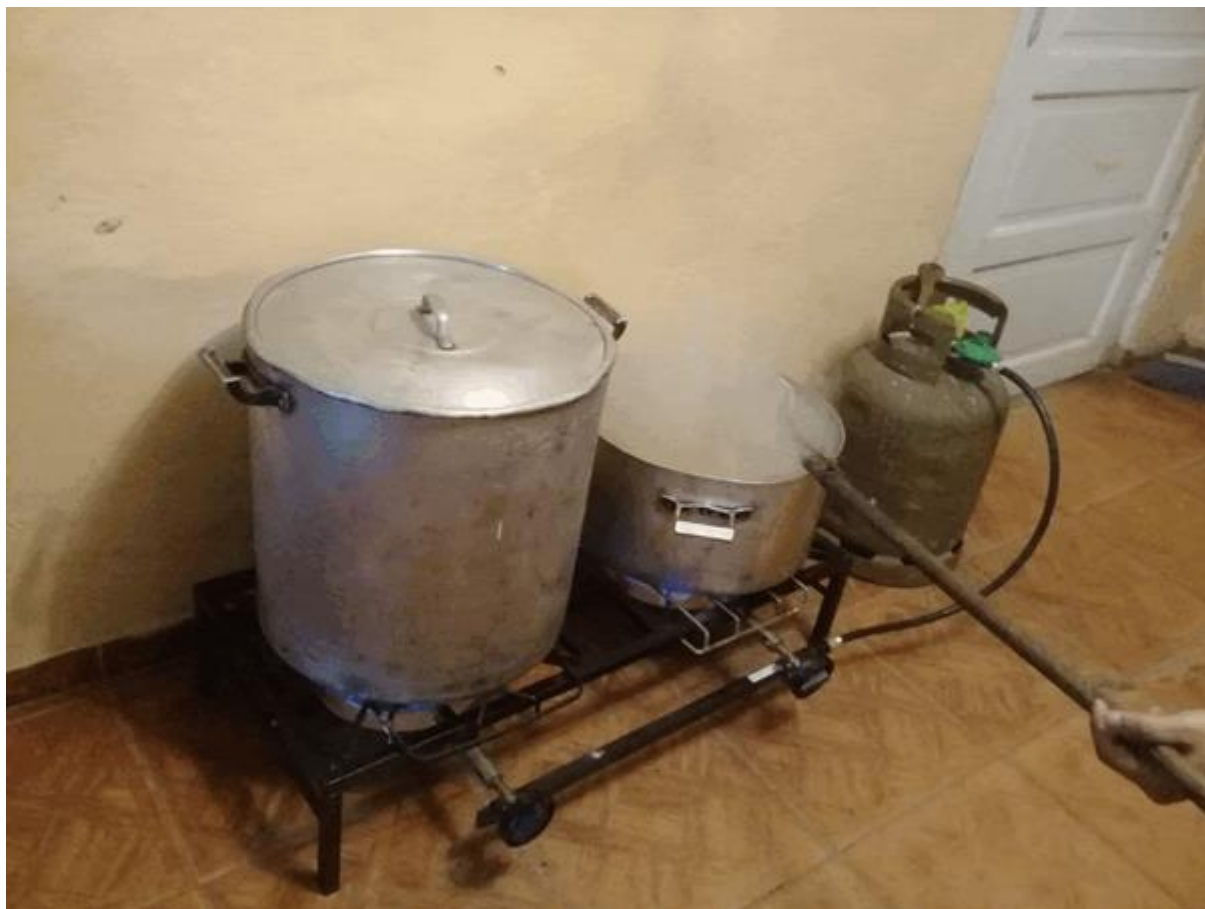
Toma directa. Fotografía digital. Córdoba 2020.