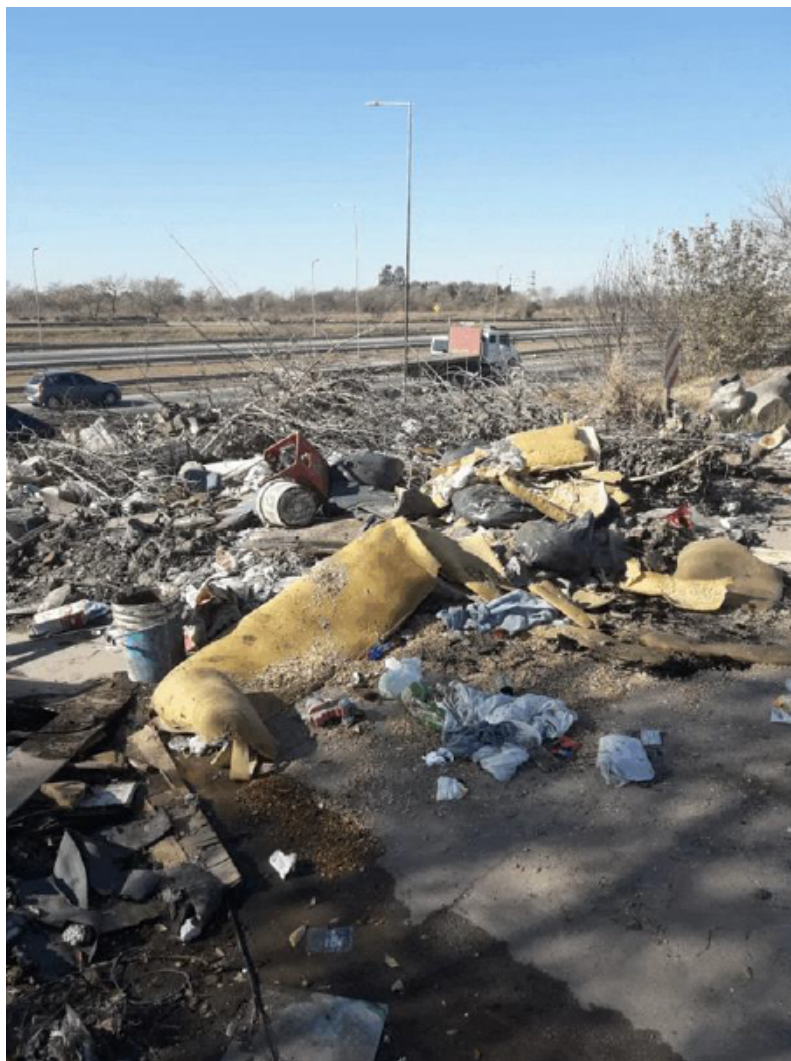
Toma directa. Fotografía digital. Córdoba 2020.

Al pedirle más detalles sobre el porqué de esas fotos, Luli me decía: