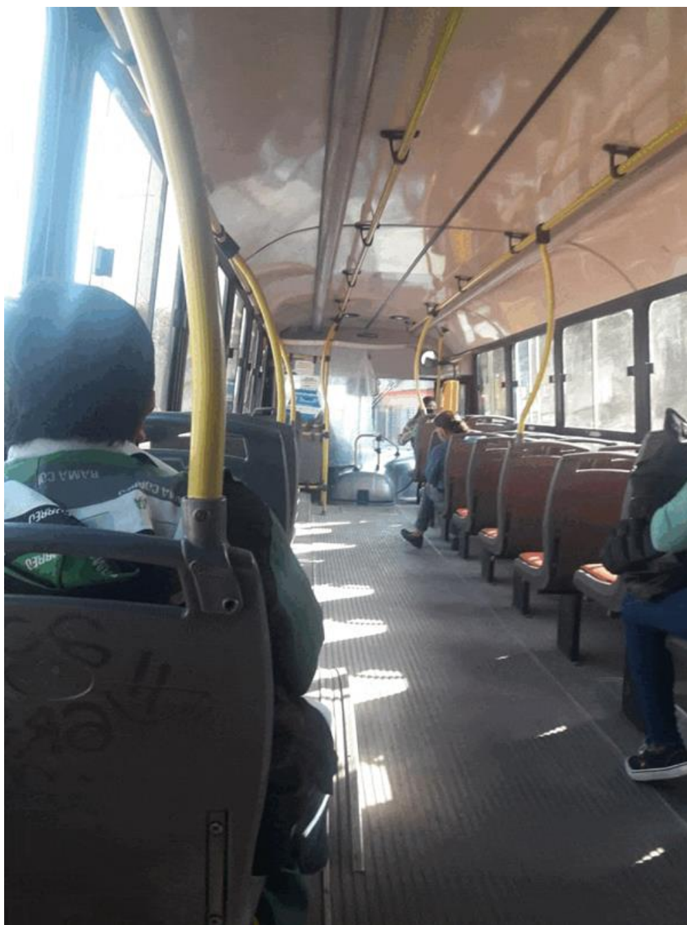
Toma directa. Fotografía digital. Córdoba 2020.