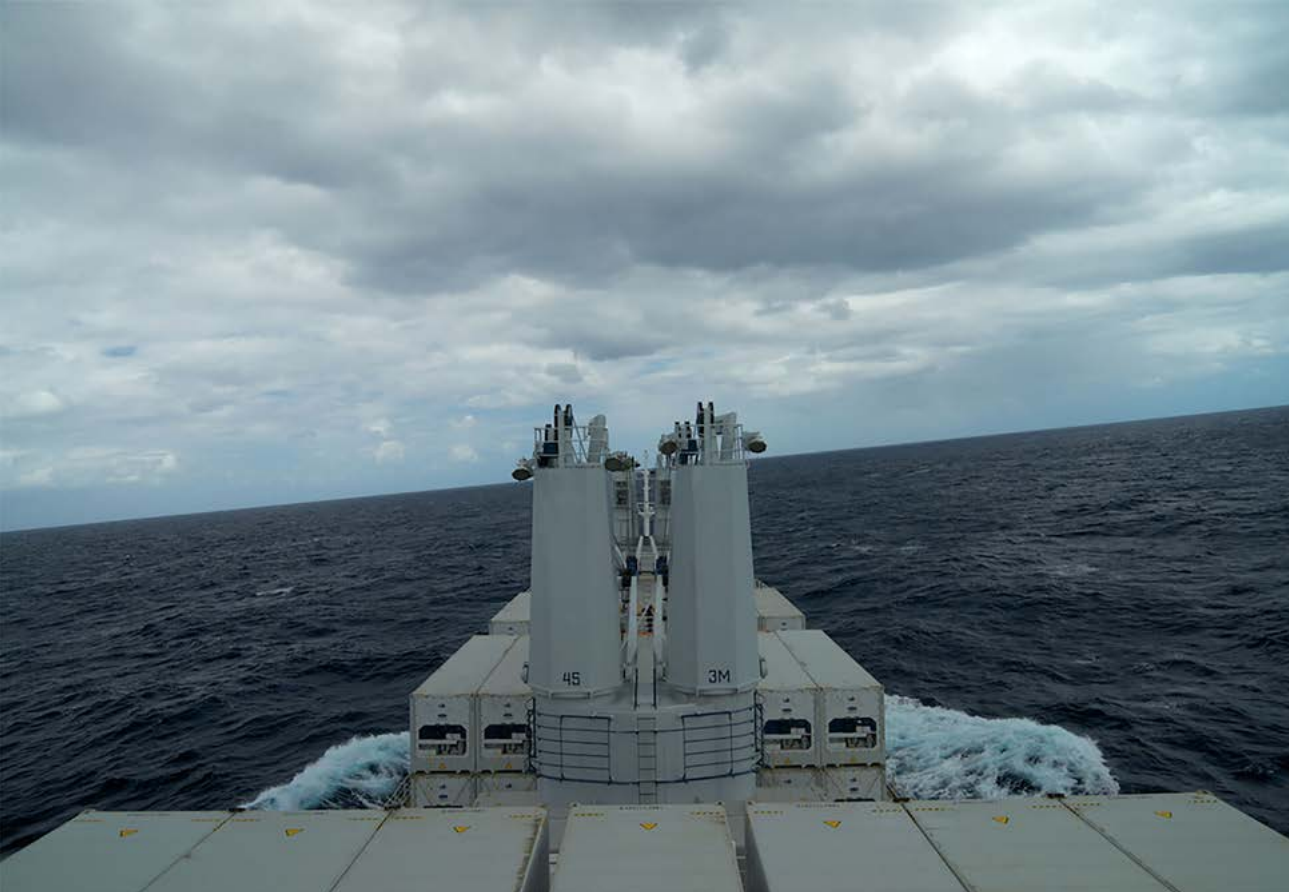
Figura 1. Enrique Ramírez, Océano 33°02'47" S / 52°04'00" N . Video HD plano secuencia de 24 días (2013)