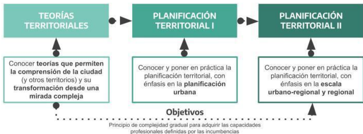
Figura N° 3. Integración Vertical al Interior del Área Planeamiento

La coordinación vertical se llevará a cabo a través del área, donde los conocimientos se amplían y profundizan a medida que se desarrollan los Ciclos, aplicando los principios de gradualidad y complejidad. Desde ésta perspectiva, la asignatura Teorías Territoriales como primer acercamiento al Área de Planeamiento, permitirá introducir al estudiante en el abordaje (incluye análisis e intervención) de los fenómenos urbanos-territoriales presentes en los asentamientos humanos desde distintas perspectivas teóricas contemporáneas. En las asignaturas Planificación Territorial I y II, a partir de las perspectivas teóricas abordadas en el primer nivel del Área tanto a escala urbana como territorial respectivamente, se comenzará a internalizar enfoques, conceptos, categorías y herramientas propias de la planificación (Figura N° 3).