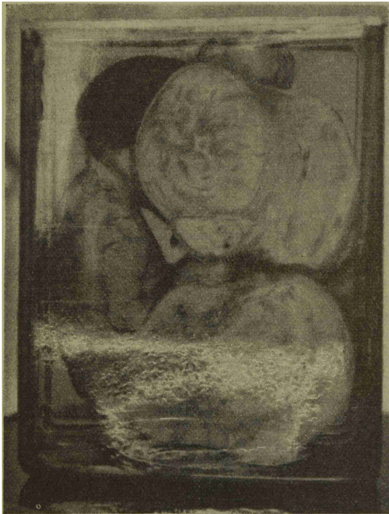
Fig. 3. — Utero en el que puede verse su agrandamiento, la cavidad endometrial y un gran núcleo miomatoso desarrollado hacia atrás; otro más pequeño en la parte superior. En la parte inferior de la figura, mal visualizada, la otra mitad uterina. A la izquierda, parte visible del feto en el frasco.

En los múltiples cortes seriados de las trompas y ovarios no se pudo constatar la existencia de vellosidades coriales, ni reacción de tipo congestivo ni decidual.