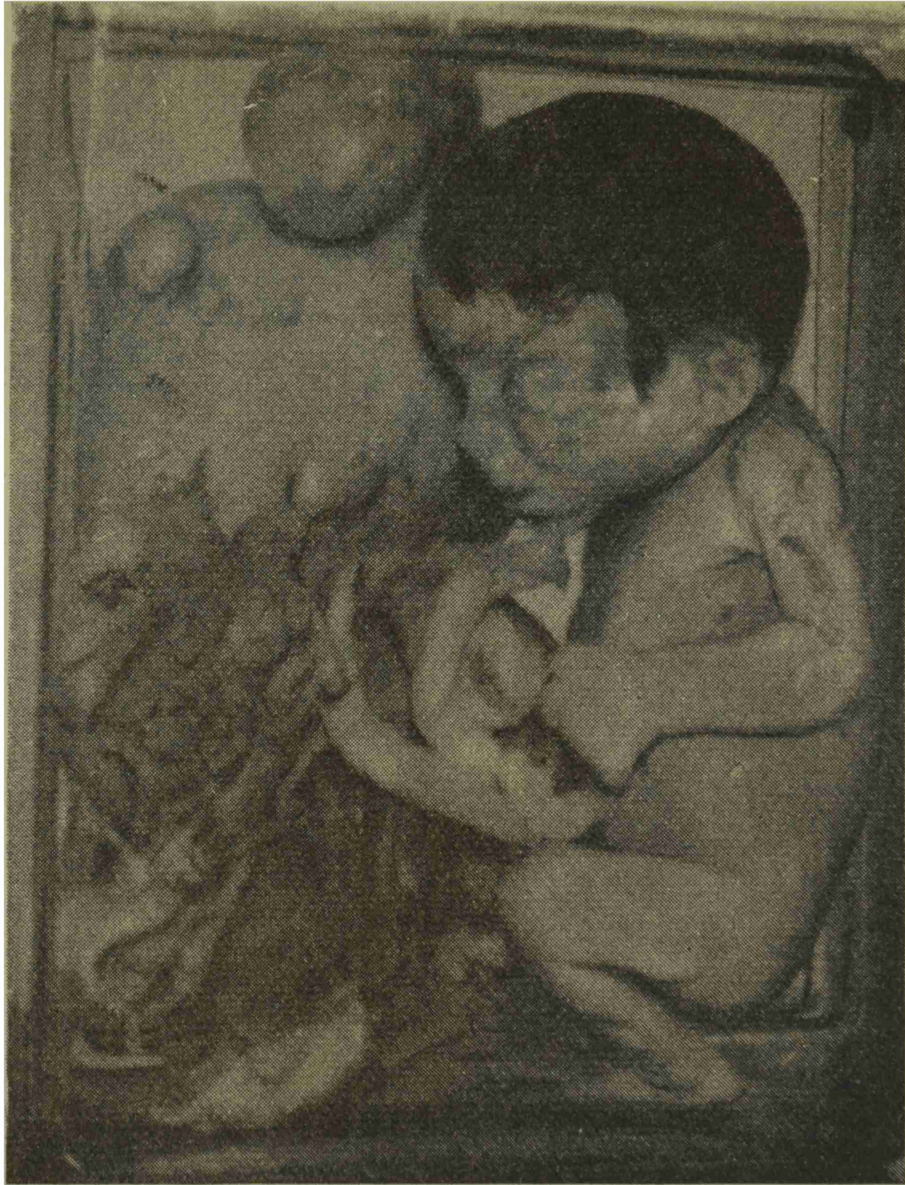
Fig. 2. — Feto con su cordón umbilical y la placenta; a la izquierda, el cuerpo uterino con varios núcleos miomatosos. Fotografía tomada dentro del frasco para mejor conservación de la pieza.

El feto mide 22 cm de cóxis a occipucio, total 32 cm. Masculino, sin deformaciones evidentes. Cordón con vasos bien conservados.