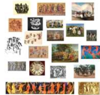
Fig. 4: El papel estructural de las danzas corales en las sociedades humanas, desde el paleolítico hasta la actualidad. Imagen procesada por lo autore.

Ejemplos de la complejidad que este tipo de conocimiento encarnado ha tenido lo vemos en la riqueza y diversidad de danzas corales que han sido fundacionales de las sociedades humanas (Fig. 4). y cuyos precursores vemos en las dinámicas de enjambres y bandadas en animales no humanos (Fig. 5).