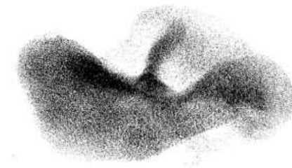
Fig. 5: El papel estructural del movimiento coral en las sociedades animales. Bandada de estorninos. Imagen procesada por lo autore.