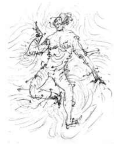
Fig. 2: Anti-hombre de Vitruvio: el cuerpo enjambre desmonta el logos geométrico heredado de Platón y que Leonardo expresa en su dibujo del “Hombre de Vitruvio”. Imagen de lo autore.