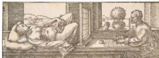
Fig. 1: Grabado de Albrecht Dürer mostrando una máquina perspectíca, circa 1525.

Frente a una tendencia a abstraernos del mundo fundada en una predominancia de la visión a la distancia, que predomina sobre todo desde hace 600 años con el punto fijo de visión de la perspectiva lineal (Fig. 1), subyacente a la era digital, propondremos recobrar el sentido de la propiocepción como matriz sensoriomotora primordial, que nos reconecte con el mundo y nos permita recuperar una plasticidad perdida (Figs. 2 y 3).