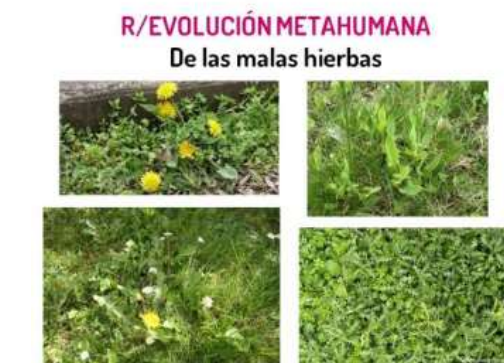
Fig. 8. R/evolución de la “malas hierbas”.

El futuro es la IC (Inteligencia Corporal), que nos permita recobrar la coevolución terrestre. Solo reinventando profundamente el movimiento podemos activar una mutación profunda del pensamiento, de la sensibilidad y del conjunto de aspectos que nos constituyen y que constituyen los ecosistemas, deshaciendo la era de grandes