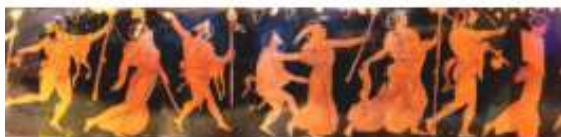
Fig. 6: Thiasos: procesión triunfal de Dionysos, seguida de Ménades y Sátiros. Montaje de 6 imágenes extraídas de un vaso de Atenas, 420-410 a.C., del pintor del Dinos de Atenas, que se encuentra en el Museo Arqueológico Nacional de Atenas. Imagen y montaje de Jaime del Val.

Las propuestas transformadoras comentadas conectan a su vez con una estética que llamo metaformance o metaformativa y que es una no basada en puntos fijos de visión propios de la sociedad del espectáculo, sino en la propiocepción y la integración multisensorial, cuyo tropo por excelencia es la danza-canto coral improvisada y sin patrón, con su epítome en el coro Dionisiaco (Fig. 6) y en numerosas danzas tribales y paleolíticas.