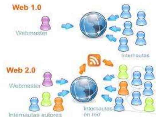
Figura 2. Evolución de Web 1.0 a Web 2.0

Esto hace referencia a una evolución desde la etapa en que los cibernautas consumen contenidos creados por personas con ciertos privilegios (acceso a plataformas tecnológicas, experiencia en programación, etc.), llamada Web 1.0 hacia una fase en que los contenidos se generan por usuarios, quienes sólo necesitan una computadora, conectividad y conocimientos básicos en el uso de la Red (Web 2.0).