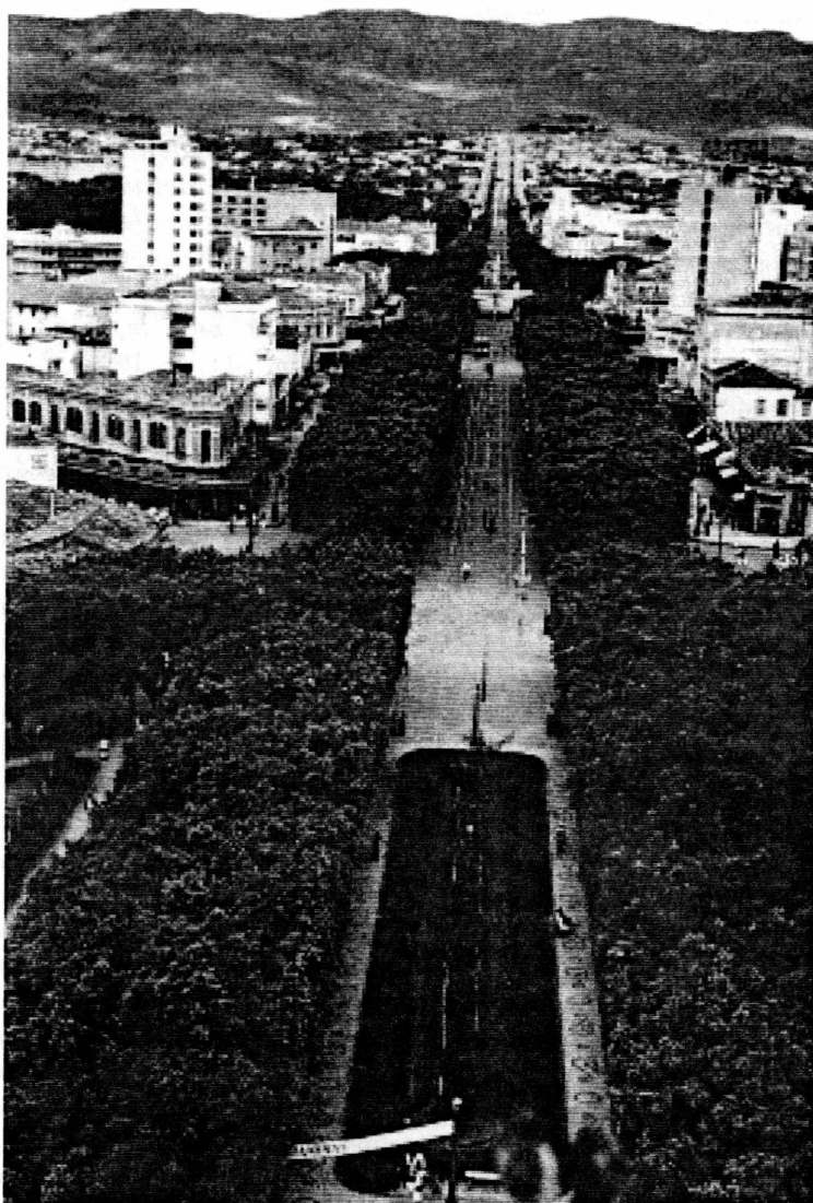
Figura 2: Avenida Afonso Pena.

condiciones naturales: topografía, salubridad, condiciones de abastecimiento de agua etc. (Assis, 1995)