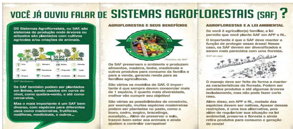
FIGURA 2. Vista interna do Folder informativo sobre sistemas agroflorestais e legislação relacionada, sendo o convite feito aos agricultores e agricultoras do Núcleo Luta Camponesa da Rede Ecovida para participarem do projeto "Elaboração de metodologia participativa para planejamento de sistemas agroflorestais em propriedades rurais familiares da região da Cantuquiriguaçu - PR"