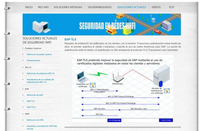
Fig. 5. Pantalla sección soluciones actuales de seguridad.

distinto tipo (Fig. 8), pudiendo visualizar algunas consultas gráficamente (Fig. 9).