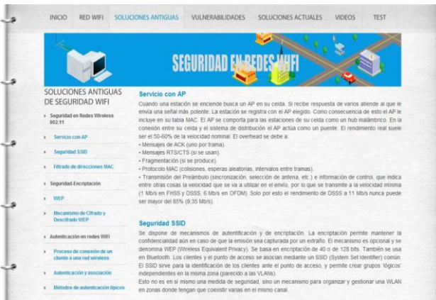
Fig. 3. Pantalla sección soluciones antiguas de seguridad.