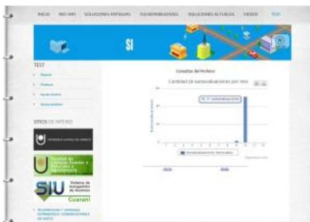
Fig. 9. Pantalla sección gráficos estadísticos.

Se proporcionó una muy buena visualización del contenido animado para poder comprender mejor las vulnerabilidades en las redes WiFi.