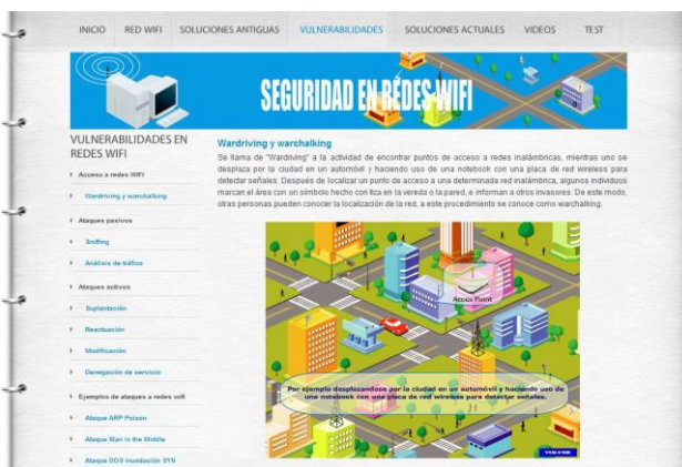
Fig. 4. Pantalla sección vulnerabilidades

El sistema brinda la posibilidad de que el profesor modifique o agregue preguntas y sus respectivas respuestas correctas, las que el sistema selecciona aleatoriamente para las distintas autoevaluaciones realizadas por los alumnos.