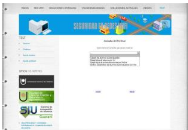
Fig. 8. Pantalla sección estadísticas.

Las distintas herramientas se han integrado de manera muy satisfactoria durante la realización de este trabajo.