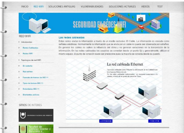
Fig. 2. Pantalla sección Red WiFi.