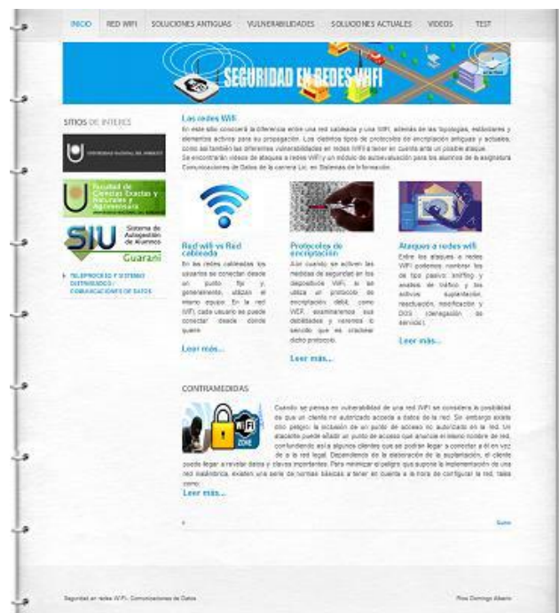
Fig. 1. Pantalla principal de la aplicación.

Al iniciar la aplicación se puede observar una breve explicación de los distintos contenidos referidos a redes WiFi que se encuentran en el aplicativo, como así también los principales enlaces de interés, permitiendo al usuario navegar a través de las distintas opciones para poder comprender mejor los temas (Fig. 1).