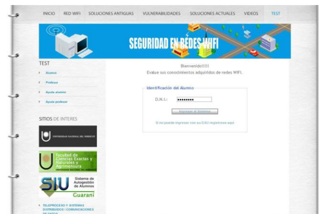
Fig. 7. Pantalla sección test o autoevaluación.