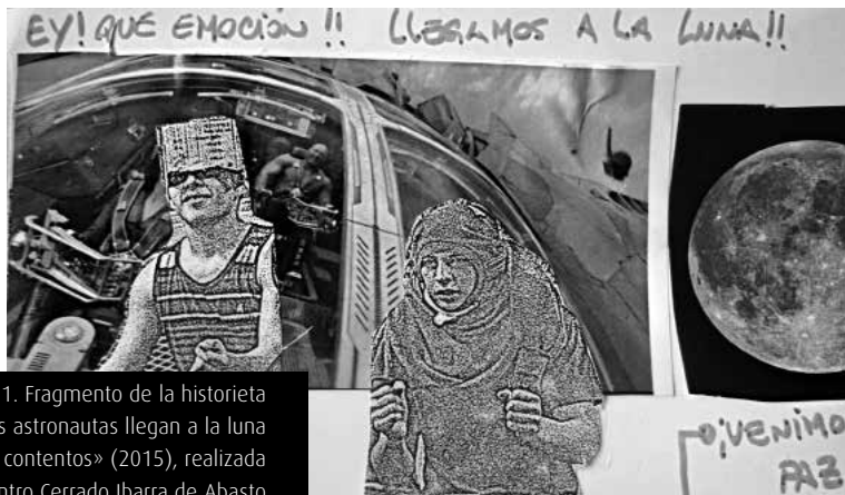
Figura 1. Fragmento de la historieta «Los astronautas llegan a la luna y están contentos» (2015), realizada en el Centro Cerrado Ibarra de Abasto

A su vez, una modalidad de trabajo transdisciplinaria (que combina y que articula elementos, estrategias y puntos de vista de diferentes campos de saber y de acción que trascienden las fronteras disciplinares) e igualitaria (que asume el trabajo en taller partiendo de modos de organización democrática y horizontal donde todas y todos los participantes tienen voz y voto) tiene como correlato un alto grado de experimentalidad, ya que se asumen las contradicciones emergentes como elementos a recuperar y no a reprimir. Lo experimental como modalidad de práctica permite valorar los procesos y los microacontecimientos como unidades principales de construcción, de producción y de transformación. En este sentido, concebimos como obra acabada a todo elemento producido en el taller del que quede algún tipo de registro (escritos, fotos, dibujos, collages, narraciones, grabaciones, etcétera). Esta decisión nos ha permitido obtener un rico y un abundante repertorio de producciones heterogéneas y originales [Figura 1] que encuentran su forma final y su medio de difusión en una publicación anual en soporte impreso (revista, poemarios y fanzines principalmente) [Figura 2].