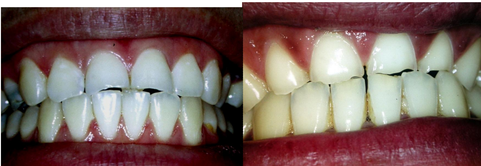
“Perdida del borde incisal por erosión”