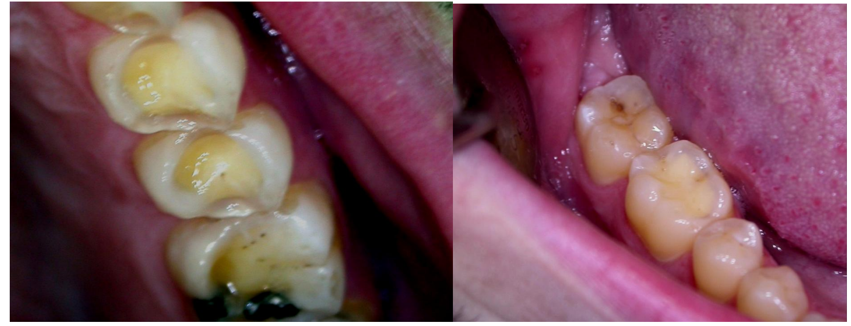
“Perdida del esmalte de la cara oclusal de molares y premolares”