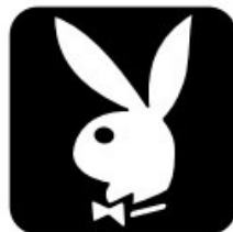
Posee pero no participa de la forma