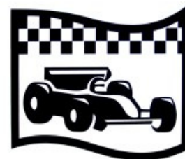
Posee y participa de la forma