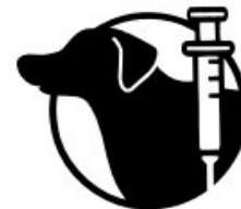
Referente: Veterinaria 2 significantes: Perro y jeringa

Todo signo será representado mediante el uso de recursos variados, los cuales pueden reforzar o ayudar a la significación, pero en otras ocasiones puede verse perjudicada por las mismas decisiones. Existen decisiones claves a la hora de crear un signo icónico, aquellas que determinaran la correcta o incorrecta decodificación del mismo. Dichas decisiones o tomas de partido se dan sobre elementos de carácter sintáctico, que deberían preverse para optimizar los resultados.