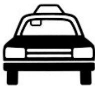
Referente: Parada de Taxi Significante único: Auto Taxi

El referente es la cosa a la que hace referencia el signo (lo que se quiere significar), esto se vehiculiza a través del signicante, que pueden ser uno o varios (combinados).