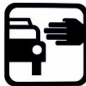
Referente: Parada de Taxi 2 significantes: Auto y mano