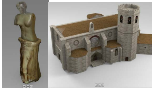
Fig. 3. Ejemplos de animación de esculturas y monumentos con RA.

Su incorporación pretende que los estudiantes reconozcan materiales, técnicas y potencialidades de las tecnologías actuales, sin desestimar los fundamentos artísticos que sustentan la asignatura en particular y la carrera en general. Por lo que se seleccionaron y reprodujeron piezas artísticas, monumentos y esculturas, tales como se muestran en la Fig. 3 y Fig. 4 .