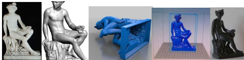
Fig. 4. Ejemplo de réplica de escultura mediante impresión en 3D.

Dichos materiales surgen del trabajo interdisciplinario de los docentes que cuentan con medios para reproducirlos y valiéndose de recursos disponibles con software Open Source y de licencia Creative Commons.