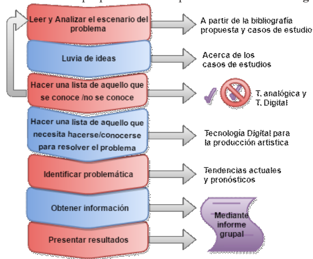
Fig. 5. Método de ABP adaptado al contexto.

A nivel de actividad se propone las fases que se muestran en la Fig. 5 :