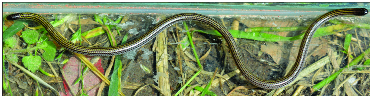
Figura 2. Epictia albipuncta , ejemplar adulto de Las Tumanas, departamento Valle Fértil, provincia de San Juan, Argentina.

escamas con pequeñas manchas castaño claro esparcidas irregularmente. Escama anal castaño claro. La cola presenta color oscuro, casi negro, tanto en vista dorsal como ventral, lo mismo ocurre en la región lateral en color castaño oscuro; en la línea media de la cola posee 12 escamas transversales al eje principal del cuerpo, como así también 12 escamas subcaudales en sentido longitudinal, sin contar el extremo amarillo de la cola, formado por pequeñas escamas imbricadas.