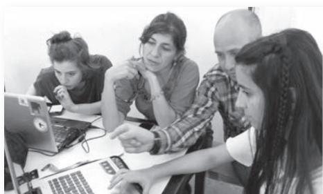
Figura 3 Seguimiento docente en el proceso de diagramación y de preparación de originales

Todas las propuestas fueron analizadas y evaluadas por los docentes y por representantes de Abuelas de la Paz. Los estudiantes también participaron con su voto y fue su voz la que definió la selección de dos trabajos que, amalgamados, constituían un producto viable [Figura 3].