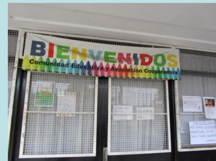
Fig. 1-Hall de la escuela primaria N5 de la localidad de Berisso.

Los resultados obtenidos fueron los siguientes: el 58 % de las madres encuestadas, reportan haberse automedicado con antibióticos, la mayoría, con Amoxicilina y ácido clavulánico, el 23 % se automedicaron con AINES (Antiinflamatorios, analgésicos no esteroides, y el 19 % con otro tipo de fármacos, tal como muestra la Fig.4