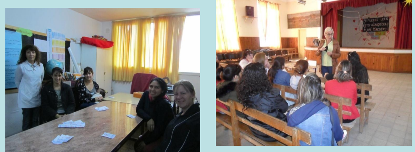
Fig. 2 y 3-Talleres sobre automedicación, con las autoridades y madres de la escuela N°5 de Berisso