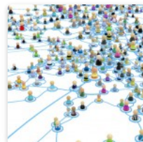
Teoría de Siemens – Parte 2