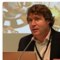
Teoría de Siemens – Parte 1