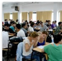
Ser estudiante hoy -Parte I