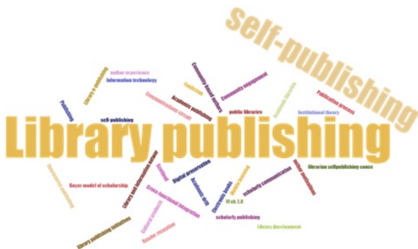
FIGURA 5 Nube de etiquetas de las palabras clave de los trabajos analizados en la SLR Elaboración propia.

Sólo un 10% de esas palabras clave hace alusión expresa a términos relacionados con el mundo digital y las nuevas tecnologías, un porcentaje muy bajo ya que los trabajos sí analizan mayoritariamente esos contextos. Quizás sea un indicativo de que este panorama (digital) empieza a ser considerado el estado habitual, y por tanto no necesita referencias ni alusiones específicas.