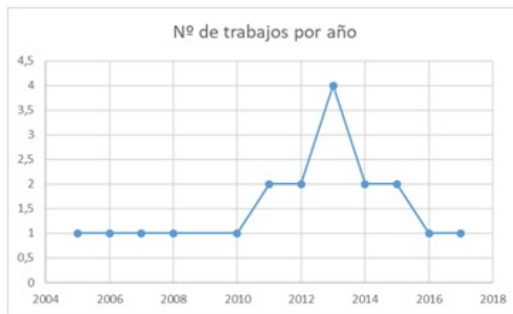
FIGURA 3 Gráfico de dispersión de la cantidad de trabajos recuperados en la revisión en relación con su año de publicación Elaboración propia.