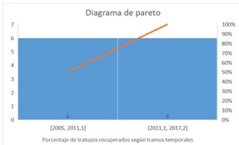
FIGURA 4 Diagrama de Pareto mostrando la distribución de los trabajos en orden descendente de frecuencia en relación con el porcentaje del total mostrado en la línea acumulativa del eje secundario Elaboración propia

Otro detalle destacable es la notoria ausencia de palabras clave, siendo que sólo el 50% de los trabajos tienen asignadas palabras clave. Tanto si la ausencia depende de la base de datos, como si depende de la revista, se trata de una práctica poco recomendable, ya que perjudica a la visibilidad y recuperación de los artículos (Mangas-Vega, Dantas, Gómez-Díaz, y Merchán Sánchez-Jara, 2017).