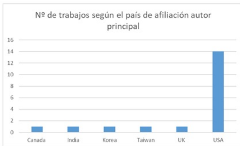
FIGURA 2 Cantidad de trabajos por país de afiliación del autor principal Elaboración propia

Este sesgo geográfico va acompañado de un claro sesgo anglosajón a nivel idiomático y temático, puesto que una gran cantidad de los trabajos analizan casos concretos de bibliotecas anglosajonas. Para descartar que el sesgo pudiera estar producido por los términos de la cadena de búsqueda (en inglés), se repitió la misma búsqueda añadiendo los términos en español, y se pudo comprobar que el idioma añadido no aportaba ningún trabajo nuevo en los resultados.