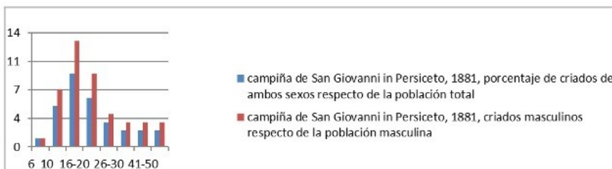
Figura 2 – Porcentaje de criados respecto de la población del grupo de edad, campiña de San Giovanni in Persiceto, 1881