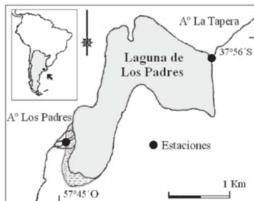
Figura 1. Arroyos vinculados a la Laguna de Los Padres: sitios de muestreo.