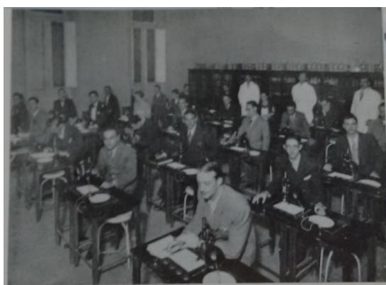
Figura 9-Laboratório com microscópios s/d

Para o preenchimento de campos específicos foi preciso buscar livros da área de Biologia e Medicina, principalmente em relação a nomenclatura correta e a função dos instrumentos científicos. Foram realizadas muitas buscas na internet , mas a pesquisa na biblioteca foi importante, porque para além dos livros e manuais usados nos cursos, encontramos fotografias antigas do Instituto e identificamos alguns dos objetos no uso cotidiano.