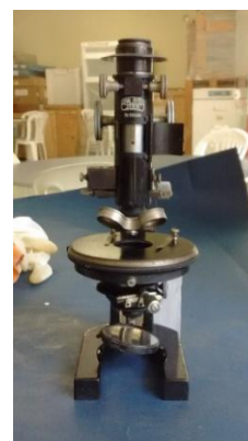
Figura 10-Microscópio identificado 2016

Outro local de pesquisa foi o Arquivo Central da universidade, onde no projeto anterior “Memória da Universidade Federal Fluminense” foi identificada a documentação da Escola de Medicina datada do início do século XX, essa é tratada como acervo histórico e permanente e serviu de base para a construção dos textos relativos a história da instituição. Ao realizar busca de documento específico que raramente são tratados como fontes, tais como: nota de compra e ou catálogos de representante de instrumentos científicos, ainda não tivemos um retorno positivo.