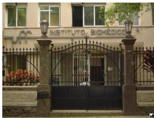
Figura 2- Atual prédio do Instituto Biomédico da UFF http://www.biomedico.uff.br/