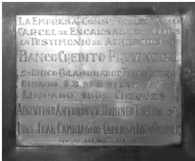
Figura 1. Detalle de la portada del álbum (1939).

El álbum de la cárcel de Olmos [Figura 1] contiene una serie de fotografías del año 1939 realizadas por un fotógrafo/a desconocido/a [Figura 2]. Se encuentran encuadradas en un álbum de gran formato y de cuero teñido, cuya portada contiene una placa de chapa labrada que, a modo de umbral, conecta el exterior con su interior. Los detalles de la arquitectura, así como las despensas y todos los servicios de los que el edificio disponía fueron cristalizados, minuciosamente, en cada fotografía.