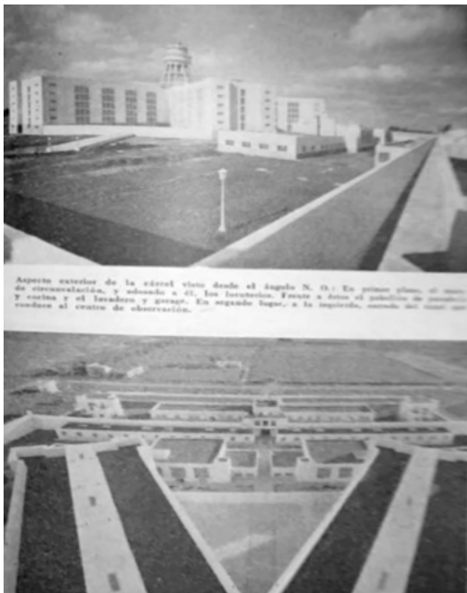
Figura 3. Fotografías de la Unidad 1 de Olmos pertenecientes al Álbum Banco Crédito Provincial , publicadas en la Revista Penal y Penitenciaria (1939).

provincia en los años de la inauguración de la cárcel. A pesar de que desde el archivo se apela al álbum como un obsequio de la constructora al Banco Crédito Provincial, la circulación de estas imágenes por ámbitos oficiales y de propaganda política, como también los puntos de contacto que vislumbramos entre la fotografía de registro estatal realizada por los talleres del MOSP, nos suscita más interrogantes que certezas: ¿cómo explicamos su circulación en estas publicaciones?