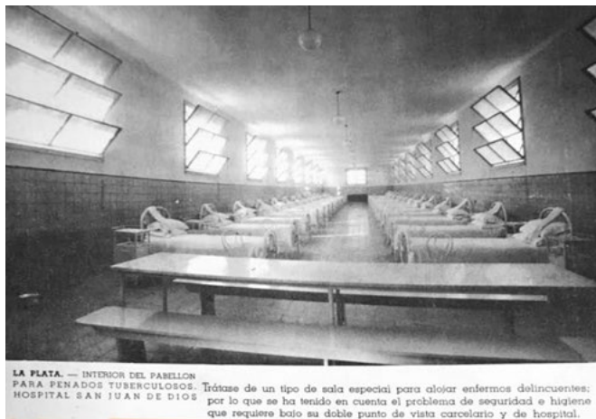
LA PLATA. — INTERIOR DEL PABELLÓN PARA PENADOS TUBERCULOSOS. Trátase de un tipo de sala especial para alojar enfermos delincuentes: por lo que se ha tenido en cuenta el problema de seguridad e higiene que requiere bajo su doble punto de vista carcelario y de hospital.

Si analizamos comparativamente las fotografías del penal de Olmos con las de otros edificios de obras públicas contemporáneas que forman parte del mismo programa político, como el caso del pabellón de tuberculosos ubicado en el Hospital San Juan de Dios [Figura 5] o la vista del patio interior de la Casa Cuna, podemos evidenciar ciertas diferencias. Tanto en las decisiones compositivas como en el modo de representar la arquitectura pública, esto podría dar cuenta de la falta de un programa de representación pautado. Esto también demuestra que muchas de estas elecciones varían de acuerdo al equipo fotográfico.