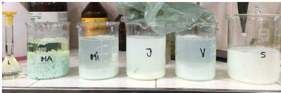
Figura2. Resultados de los ensayos en distintas muestras.. De izquierda a derecha, Muestras 1-6, respectivamente.

Las muestras identificadas con L y MA, que se corresponden con las Muestra 1 y 2 respectivamente, presentan el líquido clarificado y los flocs formados en una condición óptima del tratamiento. Las identificadas con Mi y V, correspondientes a las Muestras 3 y 5 respectivamente, representan a los casos de exceso de floculante. Las indicadas como J y S, que se corresponden a las muestras 4 y 6 respectivamente, presentan la situación de cantidad de coagulante insuficiente.