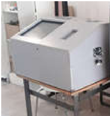
Fig. 3: Prototipo de la nueva máquina.

Pretende mejorar la comunicación con la PC de administración de los presidentes de mesa, incorporando una pantalla táctil junto a la urna. El gabinete es portable permitiendo el traslado a distintas sedes de la Universidad. También se cambió la impresora, eliminando el mecanismo de arrastre de los comprobantes.