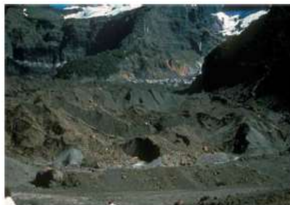
Figura 12. Glaciar del Río Manso, en 1982. Nótese el retroceso significativo del frente del hielo desde las morenas de valle marginales, y la construcción de una morena lateral abandonada, en menor escala que las anteriores, sobre la superficie de depósitos glacialacustres en contacto con el hielo.