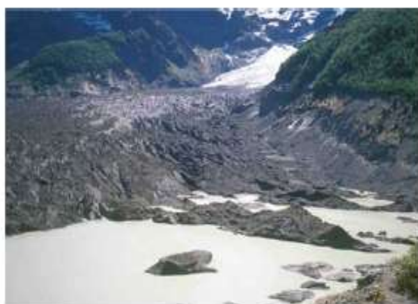
Figura 13. Glaciar del Río Manso, en 1998. Nótese la recesión aún mayor del frente del hielo con respecto a la posición de 1982, y la formación de un nuevo lago marginal al hielo, con muchos témpanos, donde antes había un poderoso glaciar.