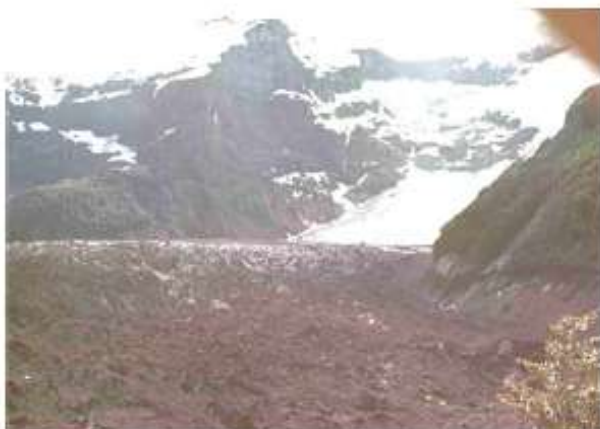
Figura 11. Fluctuaciones recientes del Glaciar del Río Manso, Cerro Tronador, Parque Nacional Nahuel Huapi, lat. 41° S, Patagonia septentrional, Argentina, en 1972. Este glaciar es una lengua glaciaria de valle, regenerada y cubierta por detritos.