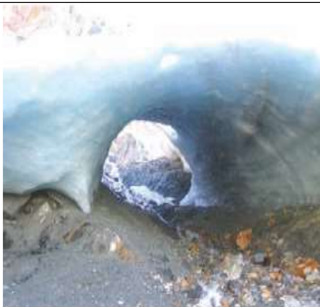
Figura 9. La cueva de hielo que se ha mostrado en las figuras 5 y 7, en febrero de 2006. Nótese la extensión mucho mayor de la cueva de hielo. El túnel de hielo es ahora mucho más corto que en años anteriores. Este sitio es de gran interés turístico pues frecuentes excursiones de trekking son ofrecidas comercialmente para visitar las 'Cuevas de Hielo del Alvear'. Es muy probable que en 2007 o 2008 ya no haya más cuevas de hielo para ser visitadas por los turistas, debido al colapso del techo de las cuevas.

Un destino similar está afectando a la mayoría de los pequeños glaciares de montaña y las lenguas de descarga que emergen de los mantos de hielo supérfites de Patagonia y Tierra del Fuego, tales como el Manto de Hielo Patagónico Norte en Chile, el Manto de Hielo Patagónico Sur de Argentina y Chile, el Manto de Hielo de la Cordillera Darwin y otros casquetes de hielo menores en el Archipiélago Magallánico en Chile. En el sector argentino de la Isla Grande de Tierra del Fuego, los glaciares de tipo alpino de los Andes Fueguinos están en un abrupto y violento retroceso como se observa en las fotografías correspondientes al Glaciar Martial y el Glaciar Monte Alvear Este (figuras 4 a 10). Muy probablemente, entre los años 2020-2030, la mayoría de estos cuerpos de hielo se habrá desvanecido, generando una pérdida invaluable desde el punto de vista del medio ambiente, el aporte de di-