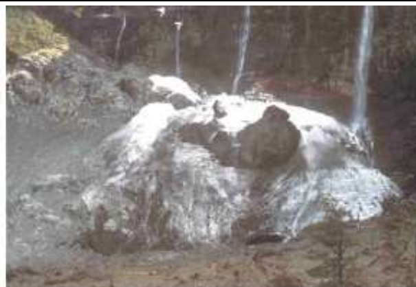
Figura 16. El Glaciar Castaño Overo, en 1987. Este es el mismo cono de hielo de la figura 15. Nótese la presencia de un gran afloramiento rocoso expuesto en la porción central del cono, como consecuencia del adelgazamiento del hielo. Este cono glaciario ha desaparecido totalmente como un cuerpo de hielo permanente y, desde la década de 1990, solo se encuentran ocasionalmente en el lugar avalanchas de hielo estacionales.