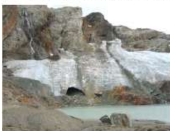
Figura 6. El Glaciar Monte Alvear Este. La porción meridional del borde del hielo tal como se veía en febrero de 2005. Nótese el tamaño agrandado de la cueva de hielo, la emergencia en este año de un gran bloque rocoso en la pared de hielo directamente a la derecha de la cueva, el cual no se observaba en la fotografía de 2004, revelando una notable recesión del frente del hielo de

varios metros en tan solo un año. Nótese también la exposición de remanentes de hielo oscuro por debajo del hielo blanco, más reciente, a la izquierda de la cueva de hielo, no visibles el año anterior. Este hielo oscuro, rico en detritos, es un antiguo remanente de hielo, de edad desconocida, quizás anterior a la 'Pequeña Edad de Hielo' (siglos XVI a XIX) y aun quizás, de una edad de varios miles de años o aun del Último Máximo Glacial (25.000 años atrás). La edad real de estos remanentes de hielo debe ser aún investigada. Lamentablemente, es posible que este hielo antiguo desaparezca rápidamente por fusión antes de que pueda ser muestreado adecuadamente. El afloramiento rocoso a la derecha de la cueva ha incrementado también su tamaño expuesto, a medida que el frente de hielo retrocedía.