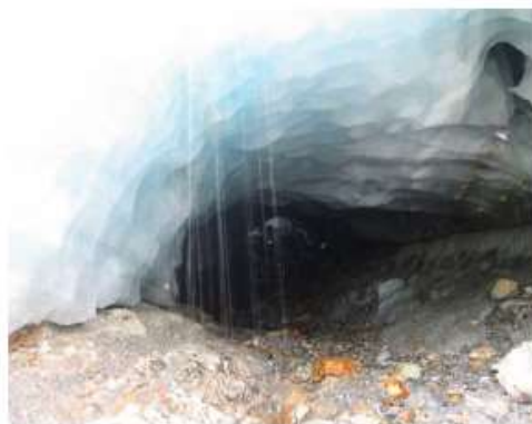
Figura 5. La curva de hielo que aparece en la figura 4, en febrero de 2004. Nótese la pequeña área iluminada en el sector más alejado de la cueva de hielo.