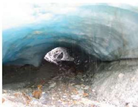
Figura 7. La misma cueva de hielo que aparece en la figura 5, en febrero de 2005. Nótese el área iluminada de mayor tamaño en el extremo más alejado de la cueva (Foto: J Rabassa).

varios metros en tan solo un año. Nótese también la exposición de remanentes de hielo oscuro por debajo del hielo blanco, más reciente, a la izquierda de la cueva de hielo, no visibles el año anterior. Este hielo oscuro, rico en detritos, es un antiguo remanente de hielo, de edad desconocida, quizás anterior a la 'Pequeña Edad de Hielo' (siglos XVI a XIX) y aun quizás, de una edad de varios miles de años o aun del Último Máximo Glacial (25.000 años atrás). La edad real de estos remanentes de hielo debe ser aún investigada. Lamentablemente, es posible que este hielo antiguo desaparezca rápidamente por fusión antes de que pueda ser muestreado adecuadamente. El afloramiento rocoso a la derecha de la cueva ha incrementado también su tamaño expuesto, a medida que el frente de hielo retrocedía (Foto: J Rabassa).