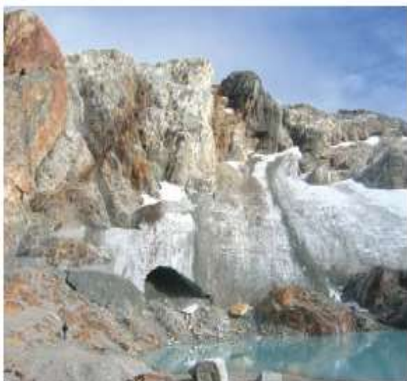
Figura 8. El Glaciar Monte Alvear Este. La porción meridional del margen del hielo, tal como se veía en febrero de 2006. Nótese el tamaño mucho mayor de la cueva de hielo en el sector izquierdo del frente del hielo, con un apreciable adelgazamiento del hielo en el techo de la cueva. El gran bloque de roca que había aparecido en 2005 ha caído del frente del hielo y yace ahora en el suelo frente a él (véase figura 6), indicando que el retroceso del frente del hielo desde la posición que tenía en 2005 es al menos de varios metros más. El remanente de hielo oscuro por debajo del hielo blanco, a la izquierda de la cueva de hielo, está más expuesto aún que en el año anterior. El afloramiento rocoso a la derecha de la cueva ha incrementado asimismo las dimensiones de su exposición.