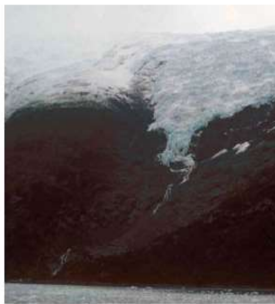
Figura 3. El mismo tributario, ahora visto desde el norte en 2004. El frente del hielo del Glaciar Upsala en contacto con el Lago Argentino ha retrocedido más de 8 km en este período, permitiendo que los barcos que navegan dicho lago lleguen hoy a posiciones en este brazo de tipo fiordo que no podían ser alcanzadas en 1981.