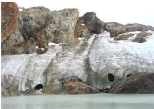
Figura 4. El Glaciar Monte Alvear Este, Andes Fueguinos, lat. 54° S. Esta es la porción meridional del borde del glaciar, tal como se veía en febrero de 2004. Nótese las relativamente pequeñas dimensiones de la cueva de hielo que aparece en el sector izquierdo del frente del hielo y las dimensiones del afloramiento rocoso inmediatamente a la derecha de él.