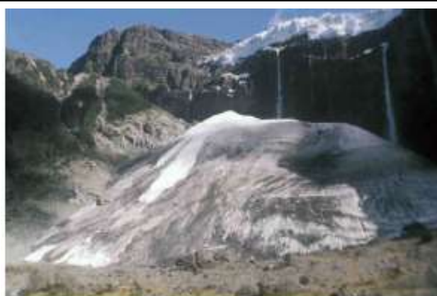
Figura 15. El Glaciar Castaño Overo, Cerro Tronador, Parque Nacional Nahuel Huapi, lat. 41° S, Patagonia septentrional, Argentina, tal como se veía en 1975. Se trata de un cono de hielo regenerado, formado por avalanchas de hielo aportadas por el glaciar superior, que alcanza a verse en la parte superior de la fotografía.