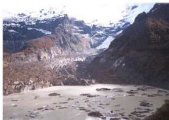
Figura 14. Glaciar del Río Manso, en 2002. El lago marginal al hielo es ahora muy extenso y el frente del hielo ha retrocedido significativamente hacia la izquierda de la imagen, y los remanentes de hielo oscuro a la derecha de la fotografía se han desvanecido. La porción inferior de este notable glaciar, importante atracción turística del Parque Nacional Nahuel Huapi, desaparecerá muy probablemente durante la próxima década.