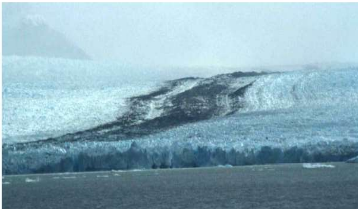
Figura 1. Glaciar Upsala, frente del hielo formador de témpanos en el Brazo Norte, Lago Argentino, Parque Nacional Glaciares, provincia de Santa Cruz, Argentina, 1981.