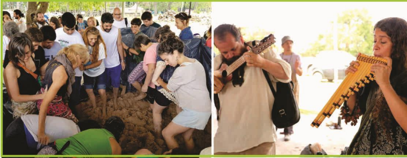
Figura 2. Pisada comunitaria.

En el tercer día, mientras se van terminando de modelar las piezas, se comienza con la construcción participativa del horno. Lo que se destaca aquí, es que en cada una de las ediciones el horno fue elaborado con técnicas diferentes. En la 3ª fiesta, el horno consistía en una cúpula armada con ladrillos uniéndolos y revocándolos con adobe (mezcla de barro y paja). 13 En la 4ª y última edición las piezas fueron mucho más grandes que años anteriores, esto obligo a repensar la manera de cocinarlas. El horno fue construido sin adobe, sino que directamente mediante la superposición de ladrillos distribuidos de manera tal que desde la cámara de combustión el fuego logra envolver las piezas de arcilla colocadas dentro y así alcanzar la temperatura para su adecuada cocción (figura 3).