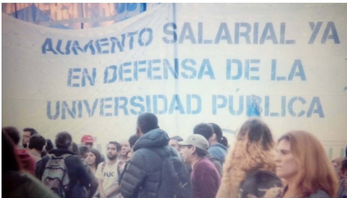
Frames del video producido a partir de la Marcha Federal Universitaria