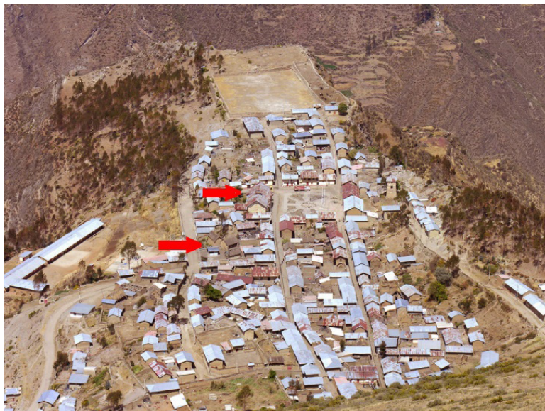
Fig. 2. Pueblo de San Cristóbal de Rapaz. Vista desde el Cerro Calvario. La flecha superior indica a la iglesia colonial, la flecha inferior indica a las casas tradicionales Kaha Wayi y Pasa Qulqa (Foto del autor, año 2005)

El ámbito de las tierras comunales abarca varios pisos ecológicos que van desde quebradas encajonadas de clima moderado hasta picos que alguna vez fueron nevados pero que ahora se muestran mayormente oscuros, ríspidos y áridos. Esta variedad de relieves y su difícil acceso le permiten conservar paisajes de singular belleza natural. El pueblo de Rapaz se ubica sobre una semiplanicie formada al pie del cerro Calvario al límite inferior de la Puna (4,050 m.s.n.m.), dominando la naciente del río Checras por su margen derecha. Se constituye así en un espectacular mirador natural desde el cual se puede observar el encajonado valle hasta casi la localidad de los baños termales de Huancahuasi, una hermosa estación turística con modernas