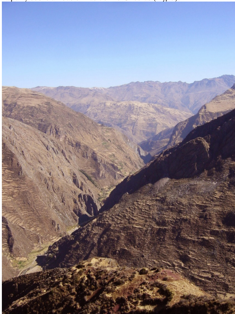
Fig. 3. Quebrada de la cuenca alta del río Checras. Vista desde Rapaz hacia Huancahuasi. Nótese las terrazas de cultivo de barbecho a ambos lados de las laderas que encajonan al río

instalaciones, ubicadas unos 5 Km aguas abajo desde el pueblo de Rapaz y sobre ambas orillas del río Checras (Fig. 3).