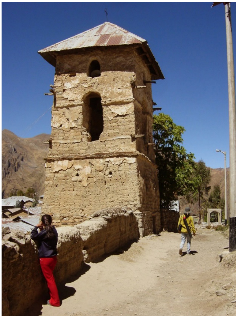
Fig. 10. Campanario exento de la iglesia colonial de Rapaz, antes de su tratamiento de conservación