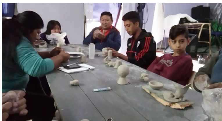
Taller comunidad qom Dalaxaix Naaq. Participantes trabajando con la arcilla industrial brindada por el Consejo Provincial Indígena a la comunidad y con instrumentos de los artesanos.