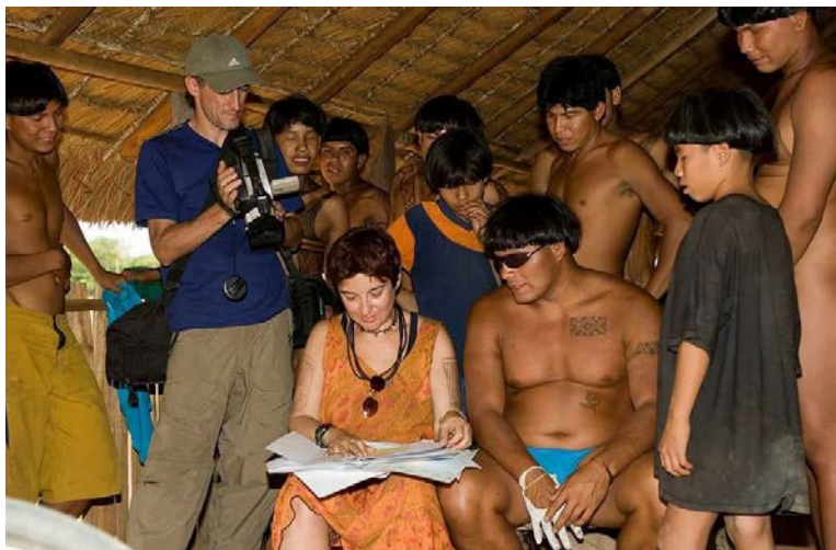
Aldeia Aiha Kalapalo. 2005.