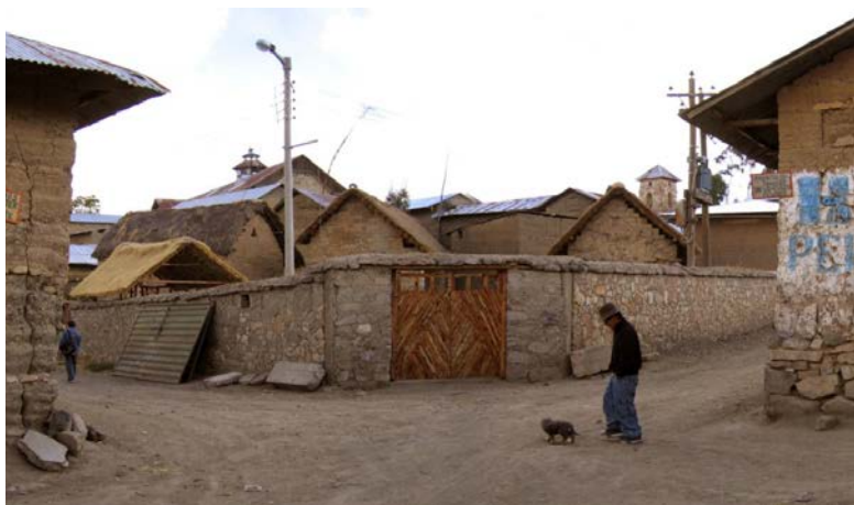
Fig. 6. Entrada principal del cercado que contiene a las dos casas tradicionales de la comunidad rapacina: Kaha Wayi (Casa de cuentas) y Pasa Qulqa (Depósito o almacén de temporada). Todo el complejo fue objeto de conservación por el proyecto de investigación “Khipus Patrimoniales de Rapaz”

campanario exento ubicado al lado opuesto y en un lugar más alto. Estos dos complejos arquitectónicos son de los más importantes del patrimonio cultural inmueble rapacino vigentes desde la época colonial y durante toda la República (Figs. 6-8).