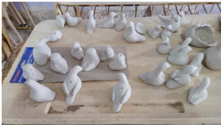
Taller de la comunidad qom Dalaxaic Naaq de La Plata. Artesanías hechas por los asistentes al taller, falta la etapa de pintura y horneado.