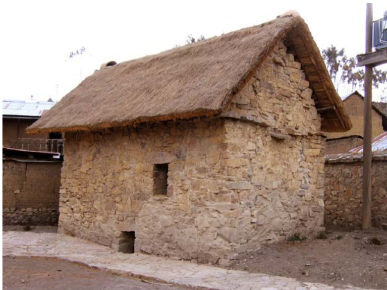
Fig. 7. Pasa Qulqa luego de su conservación. Esta estructura tradicional ya no está en uso pero su memoria sigue viva entre los rapacinos