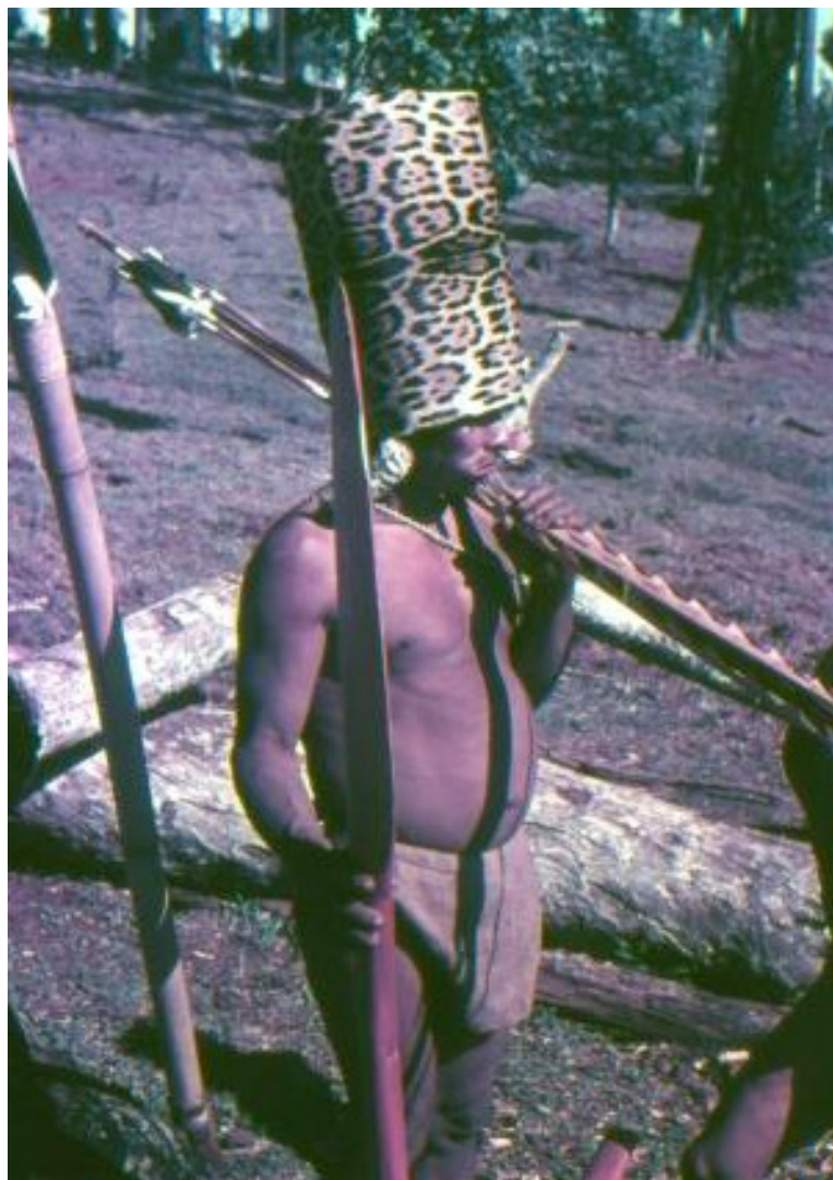
Foto de Vladimír Kozák, Serra dos Dourados. Acervo Museu Paranaense