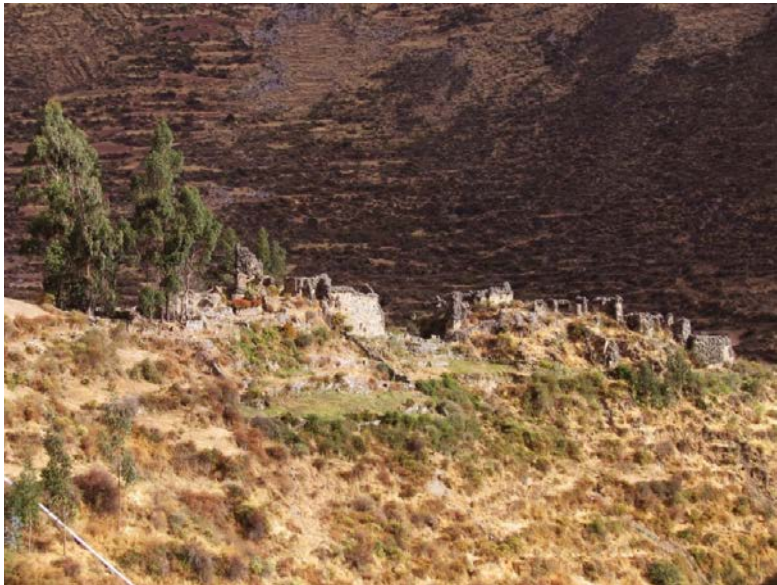
Fig. 4. Sitio arqueológico de Rapazmarca. Corresponde al Periodo Intermedio Tardío y Horizonte Tardío (Inca) de la secuencia de los Andes Centrales

Hasta mediados del siglo XX y, posiblemente, durante toda la Colonia, el pueblo de Rapaz se dividía en dos barrios tradicionales: Allauca y Lamash (Ruiz, 1981). Actualmente, estas denominaciones no se usan ni son reconocidas por las nuevas generaciones, en consecuencia, no tienen una incidencia real en la dinámica de la población y sólo ha quedado en la memoria de los más viejos. Asimismo, se abastecía de agua de un puquio cercano denominado “Ukan”, cuyas aguas eran canalizadas en dirección al poblado para finalmente dividirse en cuatro ramales que terminaban en sus respectivas fuentes o pilas de agua comunes que abastecían a cuatro barrios o sectores y en donde se satisfacían las necesidades de la vida cotidiana comunal. De estas pilas sólo queda una, la cual conserva restos de una angosta acequia empedrada que finalmente remata en dos canaletas que vertían