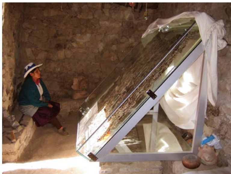
Fig. 13. Los kipus de Rapaz montados en su soporte actual dentro de Kaha Wayi