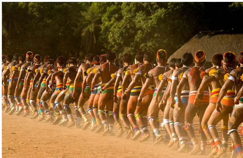
Povo Indígena Kalapalo. TIX -Alto Xingu MT.