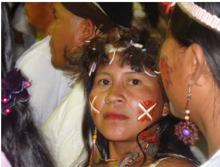
Indígenas Macuxi. TI Raposa Serra do Sol.

Constitui-se como tecnologia social fundamentada no relacionamento, na escuta, no protagonismo da comunidade, no diagnóstico participativo e na definição conjunta da principal demanda local para alcançar a ressignificação simbólica e revitalização de traços e patrimônios culturais tangíveis ou intangíveis, como as formas de manifestação cultural, rituais, culinária, jogos, tradições, crenças e costumes.