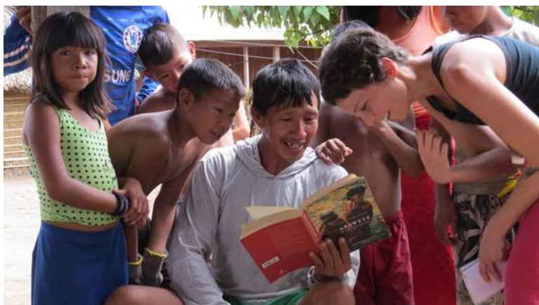
Expedição à aldeias Araweté. 2016.

A esta ferramenta chamamos Documento de Identidade Cultural , cujo produto pode ser uma publicação, filme documentário, catálogo, programa para TV, livro didático ou mesmo outros efêmeros, campanha, exposição. Também é aconselhável organizar um projeto socioeducativo com intensão de sensibilizar o público alheio ao tema.