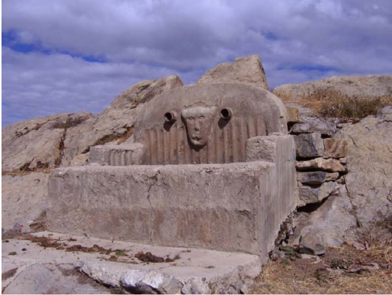
Fig. 5. Fuente colonial-republicana temprana. Una de las cuatro que abastecían de agua de puquial para el consumo humano de la comunidad de Rapaz

el agua para el uso doméstico. Una cabeza de felino orna esta fuente que ya no cumple su función pero que, aparentemente, es voluntad de la comunidad conservar pues ha sido cercada (Fig. 5).