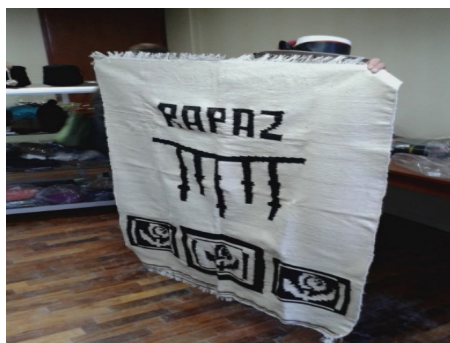
Fig. 15. Manta producida por el taller de tejido comunal, con diseño de los khipus de Rapaz

bas esferas religiosas materializadas en la misma manzana de un pueblo que está cambiando rápidamente en el marco de decisiones políticas de una dirigencia elegida y fiscalizada a la manera tradicional. La base de su modo de producir sigue siendo agropecuaria, pero los proyectos a los que destinan los fondos económicos –ahora disponibles gracias a la minera que estiman estará presente unos quince años– van desde obras de infraestructura para ser escenario de las reuniones comunales y la ampliación del centro de salud (con médico presente todos los días y con ambulancia propia donada por la Región Lima), hasta infraestructuras de esparcimiento (“estadio” nuevo, pequeño coso taurino, etc.) y un “taller de hilandería” para enseñar a las comuneras cómo tejer diversas prendas de indumentaria con “motivos autóctonos”, como el famoso khipu cuyo esquemático diseño aparece, por ejemplo, sobre mantas o en sus “chullos” (gorro andino). Sin embargo, los materiales usados para producirlos son adquiridos en Huacho y son, mayormente, de carácter industrial (Fig. 15).