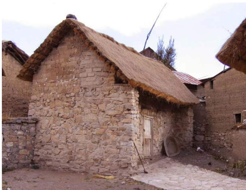
Fig. 8. Kaha Wayi luego del tratamiento de conservación. Esta casa tradicional aún es sede de reuniones de transmisión de mandos comunales y ritos agropecuarios entre los rapacinos

La vieja iglesia de arquitectura colonial cuenta con ricas pinturas murales, tanto en su fachada principal exterior como sobre casi toda su superficie interna y, un campanario exento, emplazado al otro lado de la plaza principal de Rapaz, que conserva campanas del siglo XVIII. Asimismo, la construcción de la iglesia se podría remontar a comienzos del s. XVIII, de acuerdo a fechas inscritas en las vigas de la nave mayor que registran diversos años, entre los cuales, uno de los más antiguos se remonta a 1737. En sus murales estarían presentes diversos estilos pictóricos en boga en su época, principalmente, durante la Colonia (Ruiz, 1983; Macera et al., 1995). Este impresionante edificio ha sido objeto de trabajos de conservación preventiva a cargo