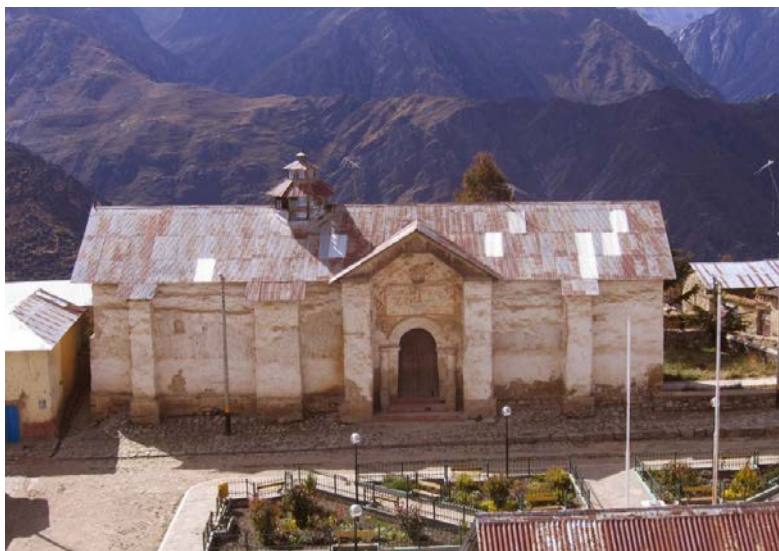
Fig. 9. Iglesia Colonial de Rapaz. Aspecto de su fachada lateral antes de su acabado de conservación final. Vista desde el campanario exento ubicado al otro lado de la plaza principal del pueblo

de un proyecto dirigido por arquitectas peruanas con apoyo de la Fundación J. P. Getty. Las pinturas murales y otros rasgos de la infraestructura eclesial han alcanzado prácticamente una intervención integral superando el aspecto de abandono y falta de mantenimiento que mostraban hasta fines del s XX. Actualmente, las intervenciones de este proyecto han continuado recuperando también el aspecto exterior de la iglesia y el campanario (Figs. 9-11).