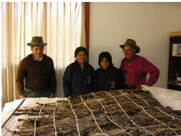
Fig. 12. Proceso de limpieza y conservación de los khipus de Rapaz en el gabinete especialmente montado en el cerco que contiene a las casas tradicionales. A la derecha, Frank Salomon y las conservadoras hermanas Choque

Mención aparte merecen sus famosos khipus los cuales han sido objeto del proyecto de investigación antes mencionado y que, a la fecha, ha producido varios trabajos publicados que muestran la complejidad de su naturaleza e interpretación (Salomon et al. 2006; Salomon et al. 2011; Salomon et al. 2016). Aquí basta recordar que las casas tradicionales –en cuyo contexto funcionaban– han sido conservadas por el proyecto y la colección de khipus se mantiene conservada y resguardada en una vitrina dentro de Kaha Wayi (Figs. 12 y 13).