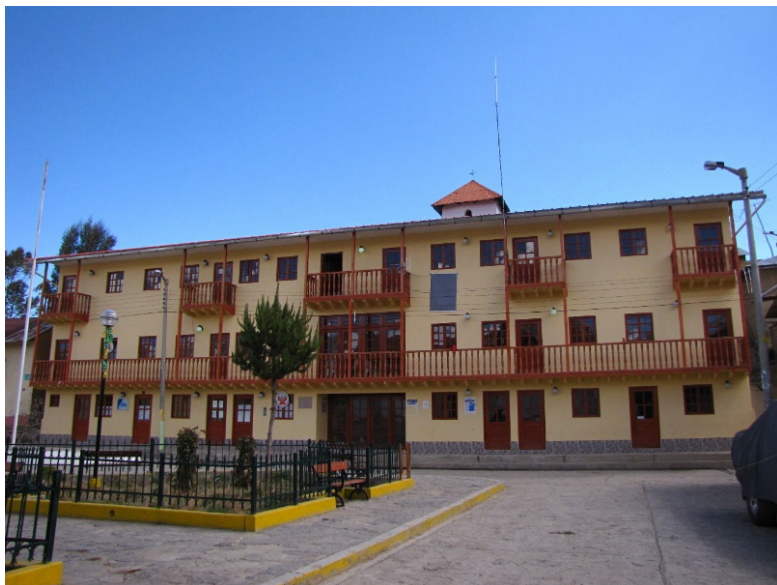
Fig. 14. Nuevo local municipal (multiusos) de la comunidad de Rapaz de tres pisos, inaugurado el 2015. En la parte alta, apenas sobresale la torre del campanario exento. El local anterior era de adobes y tenía dos pisos, de modo que la torre del campanario tenía mayor presencia sobre la plaza principal del pueblo (Foto del autor)

El pequeño bus con que cuenta la comunidad había sido cambiado apenas hace un año. La ruta –hacia la ciudad de Oyón– también fue mejorada gracias a una carretera afirmada y mantenida por el gobierno regional y/o la minera, que acorta el tiempo de viaje y lo hace más seguro y ameno. Sin embargo, esto no fue pensado para que los visitantes tengan más seguridad y comodidad con el objetivo de aumentar su flujo. El empleo de esta ruta favorece –casi exclusivamente– el circuito comercial de los rapacinos, interesados en asistir a una feria comercial en la ciudad de Oyón. El bus sólo hace el viaje Rapaz-Oyón-Rapaz una vez a la semana, excepcionalmente, dos. Entre viaje y viaje, el mismo permanece estacionado en la plaza de