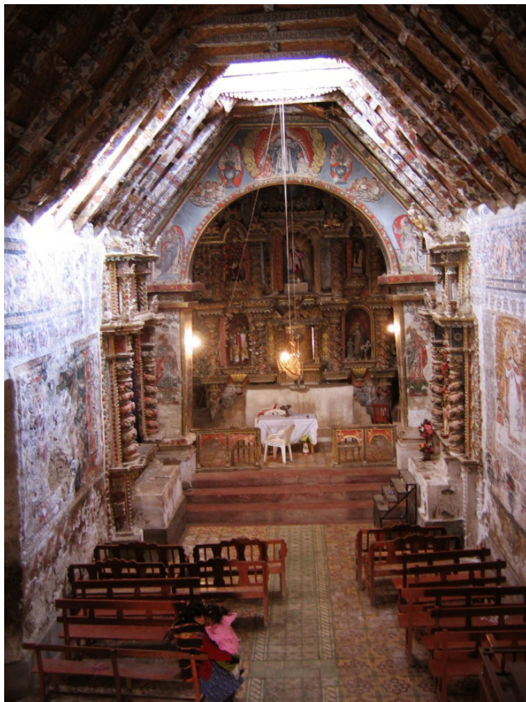
Fig. 11. Interior de la iglesia colonial de Rapaz. Nave central, nótese las vigas pintadas de su techo. Las horizontales del centro llevan inscripciones de los donantes y los años de su instalación