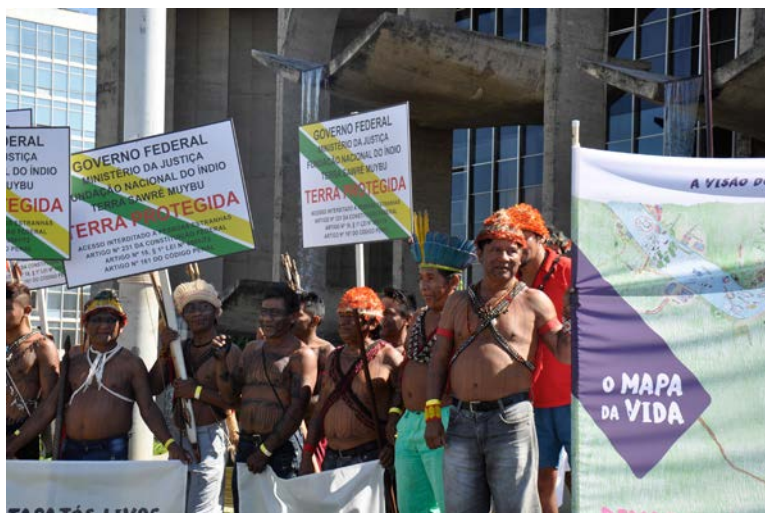
Acampamento Terra Livre 2018. Ato enfrente ao Ministério da Justiça. Povo indígena Munduruku.

Segue-se o relato da metodologia que utilizamos na realização dos projetos: “Jogos e brincadeiras na cultura Kalapalo”; “ A vitória dos netos de Makunaimi”; “ Fulkaxó, ser e viver Karirí-Xocó”; “Baré , povo do rio” e “Gaúchos e Gauchos, Argentina, Brasil e Uruguay” no Sesc – Serviço Social do Comércio 99 no Estado de São Paulo.