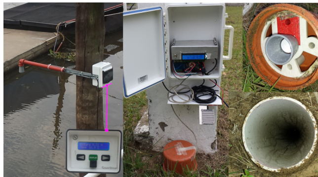
Figura 2. Distanciómetros acústicos: altura hidrométrica (izq.) y nivel freático (der.).

Para la medición del nivel freático se han llevado a cabo dos enfoques, idéntica a la mencionada con anterioridad para altura hidrométrica y utilizando sensores de presión sumergidos. Para el primer caso, se diseñaron con una impresora 3D los complementos necesarios para acoplarlos al extremo superior del tubo de la perforación, cuidando que la visión del sensor sea colineal al tubo. Para el caso del sensor de presión, se utilizó uno diferencial ya que es necesario compensar la presión atmosférica. Para todos los casos se utilizaron sensores digitales 4 cuya comunicación con el datalogger es mediante protocolos I2C, SPI y Serie.