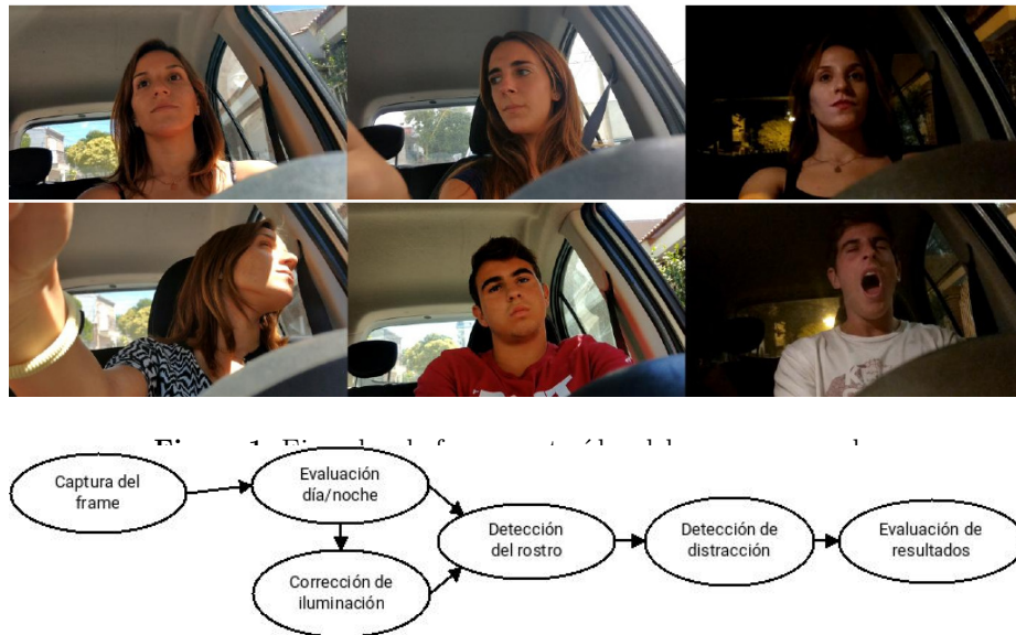
Figura 2. Esquema general del sistema.

aplica una corrección gamma [3]. La evaluación se realiza sobre el histograma RGB de una ROI de la imagen que no contiene al conductor. Para la etapa de detección de rostro se exploraron dos alternativas, una basada en LBP (del inglés, Local Binary Pattern) [1] y la otra en clasificadores en cascada basados en características de Haar [11]. Luego de evaluar el comportamiento sobre nuestro Corpus, se decidió utilizar Haar en su implementación de OpenCV [5] ya que se comportó de forma más estable. Sobre el rostro detectado, se obtienen 68 puntos característicos (landmarks) utilizando la librería Dlib [6]. Utilizando 14 de estos puntos, se hace un mapeo 2D \rightarrow 3D , para poder evaluar la orientación del rostro 7 . Finalmente, es posible obtener los 3 ejes sobre el rostro que indican la orientación de la cabeza (ver figura 3). En la etapa de detección de distracciones, se evalúan los ángulos computados y se comparan con umbrales empíricos. Es importante destacar que las distracciones se evalúan sobre un buffer de resultados que permite evitar errores de cálculo instantáneo.