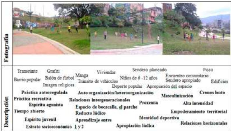
Imagen 1. El “torneo” de los niños en la manga.

La manga (espacio verde) observada en el siguiente fotograma es parte del proyecto del puente de la Madre Laura. 6 Este espacio verde rompe el espectro gris que tiene este tipo de construcciones urbanísticas; presenta una ciudad nueva, un barrio marginado nuevo.