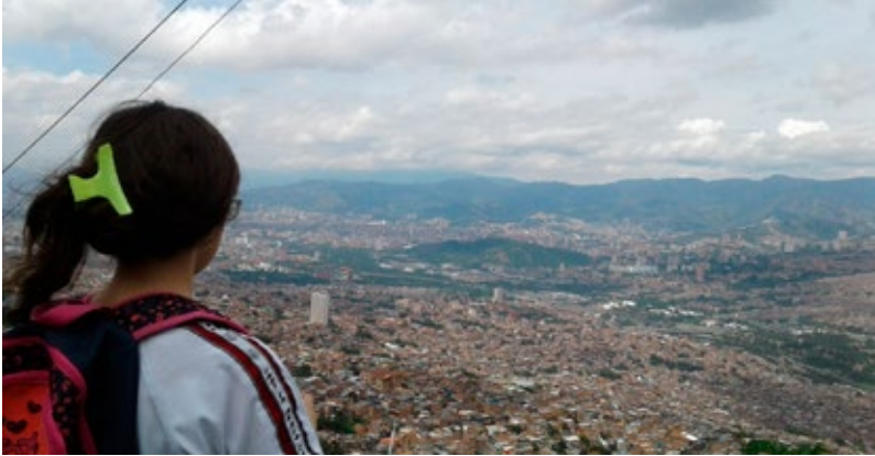
Foto 1. Estudiante en modo “viaje”. Los estudiantes en la etapa de viajes hacen registros audiovisuales, escriturales de lo que sucede en el lugar. La ciudad como texto. Autor: Marco Fidel Gómez Londoño.

Cuando salimos de la escuela para callejear, 5 se establecen otros modos de acercarnos a la calle y de reconocer en ella otros nodos que parecen invisibles en la dinámica escolar. No se trata de un paseo (aunque tenga algunas de sus características, por su componente lúdico), pues tiene intenciones epistemológicas, pedagógicas y educativas. A su vez, los cuerpos y sus prácticas en el callejeo muestran unos modos con mayor despliegue, pues en la escuela (en los procesos de escolarización), las relaciones parecen estar configuradas por otras lógicas que permiten un menor grado de incertidumbre (Calvo, 2016). Bien afirma Galindo (1992) que la calle es el escenario número uno de la vida ciudadana; allí se enseña, nos muestra nuestro rostro, y se exponen descarnados el cuerpo y el alma del mundo contemporáneo.