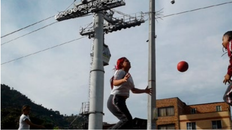
Foto 2. El juego en las barriadas de Medellín. Cuerpos juveniles, lúdica y calle. Autor: Marco Fidel Gómez Londoño.

El cuerpo y la calle han configurado experiencias previas, que el callejear potencia. El barrio, entonces, se reconoce en las experiencias de los sujetos y en sus modos de ser y estar corporales. Experiencias que contienen historias de vida de las personas, de lo que han vivido, de lo que han sufrido, de los avatares, de las posibilidades latentes, de las esperanzas y de los miedos. En el callejear hay una pedagogía que no es externa a “las realidades, subjetividades e historias vividas de los pueblos y de la gente, sino parte integral de sus combates y perseverancias o persistencias [y de]sus bregas —ante la negación de su humanidad— de ser y hacerse humano” (Walsh, 2013, p.13).