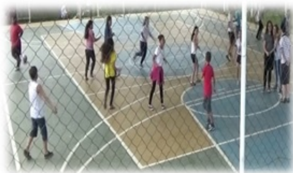
Figura 2 – Interação e mediação os alunos

Ao optarem em abraçar os colegas que tinham maior afinidade, discutiu-se sobre a possibilidade de deixarem um colega na selva para os animais selvagens devorarem, pois esse era o ambiente simbólico estabelecido. Assim, após a intervenção docente acabaram abraçando à todos, independentemente da relação que estabeleciam fora do momento da aula. Logo, houve participação de todos os alunos, tornando o ambiente do jogo, um espaço de alegria, prazer e descontração e convivência social.