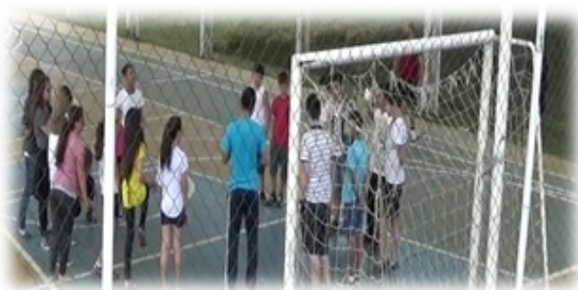
Figura 1 - Apresentação de imagens e fotos referentes ao atletismo

A primeira resistência à proposta apresentada se deu em função da predominante cultura do futebol como conteúdo hegemônico. E a partir daí, o questionamento provável, surgiu! Um aluno interrogou quando teriam futebol, com apoio e cumplicidade de muitos. (O autor)