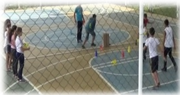
Figura 4 - Jogo de Caça Primitiva

Um aluno estava com dificuldades em acertar o alvo (animal selvagem) e derrubou com a mão quase que de forma invisível e comemorou perpassando aos outros o seu êxito e a forma de conquista-lo, o que foi seguido pelos colegas ao se depararem com a mesma situação.