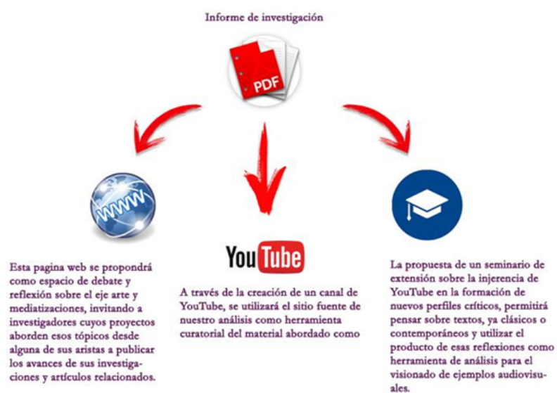
Figura 5. Diagrama de Componentes

Subcomunidad Grado- Colección/ Trabajos Finales : a la fecha están disponibles en acceso abierto el total de los trabajos recibidos (32) considerando los mismos a partir del 2012. La carga de los Trabajos Finales de Grado del período 2014 a la fecha se completará una vez que se reciban los 9 trabajos faltantes cuyos autores aún no han enviado o están incompletos. Cabe mencionar que previo a la carga de los objetos digitales, se realizó la solicitud y recolección del material, efectuando tareas de ordenamiento, catalogación y edición en formato .pdf. Fue necesario también realizar el diagrama que agrupa los componentes de cada trabajo final para dar cuenta de forma dinámica de su configuración compleja, proceso que muestra la figura 5.