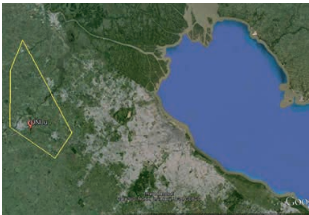
Figura 1. Mapa de la región noreste de la provincia de Buenos Aires donde se colectaron las muestras.

Los aislamientos fueron sistemáticamente colectados de 17 campos de producción comercial de vegetales del noreste (NE) de la provincia de Buenos Aires durante 2011 y 2012. Los lugares de muestreo se encuentran en las ciudades de Luján (N= 7), Rodríguez (N= 34) y Exaltación de la Cruz (N= 20) (entre las coordenadas: 34° 19' 14.05" S; 59° 11' 58.87" O y 34° 41' 33.75" S; 58° 54' 4.25" O). Los aislamientos fueron recuperados de las siguientes especies: zapallito, N=37 ( Cucurbita maxima Duchesne ssp. Maxima