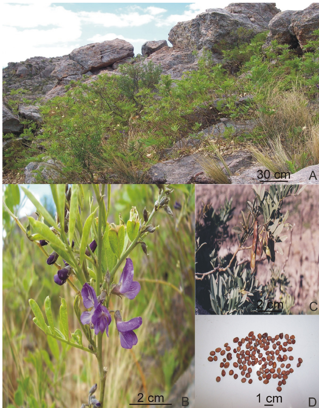
Fig. 2. Apurimacia dolichocarpa . A) Fisonomía de un individuo adulto; B) Inflorescencia; C) Fruto y D) Semillas.