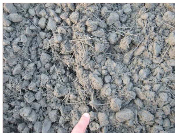
■ Figura 3. Detalle de la distribución homogénea de las fibras.

la balanza, y que el agua de lluvia degrade el envoltorio de los rollos de fibras.