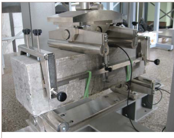
■ Figura 2. A la izquierda vista de los dispositivos de ensayo. A la derecha la configuración de carga y curva del HRF.

Este apartado sintetiza los estudios realizados para seleccionar el tipo y contenido de fibras a emplear en obra. Se describe la metodología de evaluación y el equipamiento empleado para la caracterización mecánica, se muestran algunas de las alternativas en cuanto a tipo y dosis de fibras exploradas y finalmente se describe el HRF seleccionado.