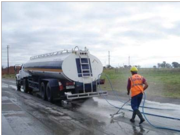
■ Figura 4. Limpieza intensiva mediante hidrolavado y posterior barrido con aire comprimido.

Respecto a la terminación, aunque se observaban algunas macrofibras expuestas parcialmente sobre la superficie del hormigón, esto no afectó el texturado del hormigón. En cuanto al curado se destaca el desempeño del compuesto líquido utilizado, que garantizó la formación de la membrana en tiempo y forma bajo cualquier condición climática y de exudación del hormigón. Tal fue el éxito de este producto, y ante la ausencia de fisuras plásticas, que se planteó un tramo experimental para discernir la utilidad de incorporar microfibras cuya principal función es controlar la fisuración plástica.