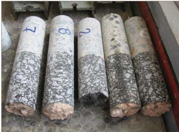
■ Figura 5. A la izquierda testigos para evaluar la adherencia. A la derecha ensayo de corte en la interfase.