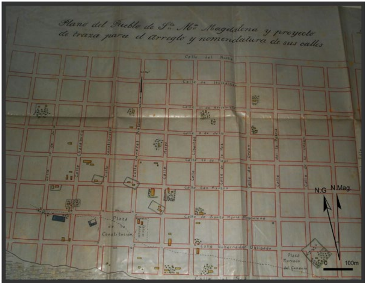
Figura 4. Plano del Pueblo de Santa María Magdalena y proyecto de traza para el arreglo y nomenclatura de sus calles, realizado por Jaime Arrufó en el año 1854 (AHGyC, MOP, Exp. 12 de Magdalena).

en sentido aproximado N-S, ya que según sus palabras ocasionaba el menor perjuicio posible y consideró que esto era así porque previamente se había seguido una orientación similar.