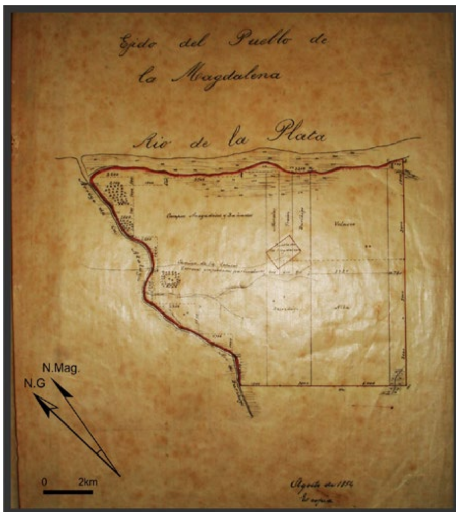
Figura 3. Propuesta de ejido del pueblo de la Magdalena, Arrufó 1854 (AHGyC, MOP, Exp. 12 de Magdalena).

los pueblos con su propuesta de traza y delimitar los límites de los ejidos (Canedo 2011). En el caso particular de estudio, en 1854 Jaime Arrufó, a cargo de la comisión Sur, realizó dos nuevos planos. En el primero, titulado “Plano del Ejido del pueblo de la Magdalena” 13 (Figura 3), el agrimensor delimitó el ejido, tomando los mismos accidentes naturales como límites aunque extendió su superficie hacia el sur de la cañada con respecto al plano de Saubidet. De esta manera, dos de sus lados resultaron irregulares por la presencia de cursos de agua, áreas de bañados y zonas anegadizas. En la mensura, aclaró que no podían seguir adelante por los inconvenientes de la topografía, por lo “fangoso del terreno y los espesos matorrales” 14 . Cabe señalar que si bien la ocupación ejidal era para la producción agrícola para el abasto, Arrufó señaló que este ejido estaba compuesto por tierras poco apropiadas para la labranza por ser anegadizas a lo que sumó la escasez de “brazos” para trabajarla. Indicó el camino a la capital y orientó el pueblo en relación al norte magnético.