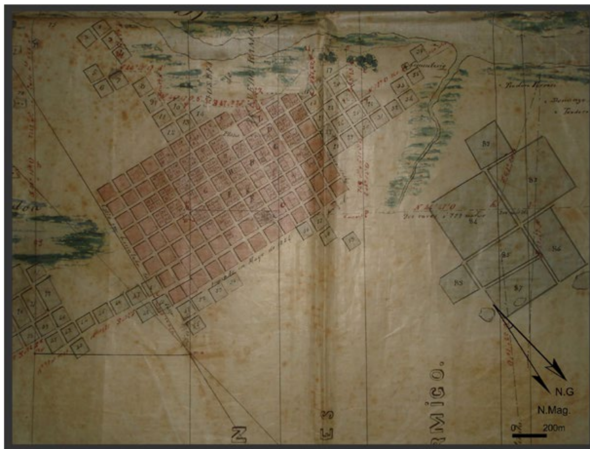
Figura 5. Detalle del plano del ejido de la Magdalena realizado por Pedro Benoit en 1860 (AHGyC, MOP, Exp. 34 de Magdalena).

La población del partido en el Censo nacional de 1869 cuantificó 7879 habitantes, de los cuales 1506 habitaban en el pueblo en 131 unidades censales. En el pueblo se registraron 87 casas de azotea, 13 de madera y 226 de barro y paja. Como puede notarse, era un pueblo pequeño y gran parte de la población residía en casas precarias. El plano, con una escala menor, no recogió las construcciones y sus ubicaciones en el pueblo.