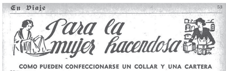
Figura 2. Ejemplos de imágenes de secciones en las guías turísticas, modelizadores de la imagen femenina.