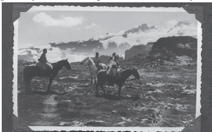
Figura 3. Mujeres de montaña en Argentina en las décadas del treinta y cuarenta.