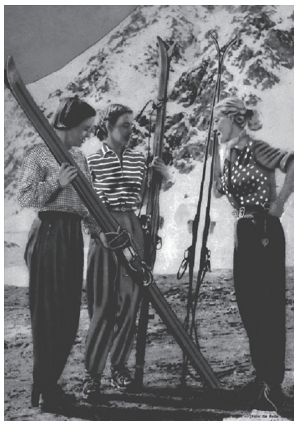
Figura 4. Tapa de la revista En Viaje , 1954.

Mujeres indómitas, compañeras de los varones que aparecen como pares (aunque no iguales), son reconocidas por su juventud y su belleza. Estas mujeres se muestran con actitudes desafiantes, alejadas de una posición de sumisión. Estas deportistas parecen hacer honor a la descripción de la Patagonia del naturalista Guillermo Hudson, quien a finales del siglo XIX describe el territorio como “[...] una bella y salvaje ondina